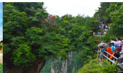
สะพานหนึ่งใบใต้หล้า

วันที่หก จางเจียเจี๋ย-ขึ้น-ลงลิฟท์แก้วเที่ยวเขาเทียนจื่อซาน-ภูเขาอวตาร-สะพานหนึ่งในใต้หล้า -ออฟชั่นะจก สะพานกรจกข้ามเขาแกรนด์แคนยอน