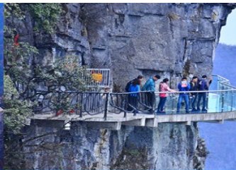
หน้าพลาวยฟ้าทางเดินกระจก