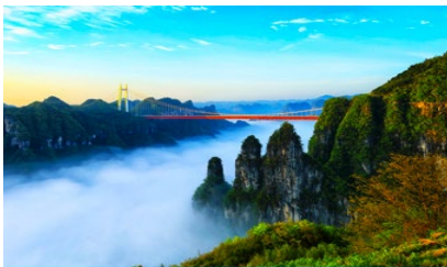
อุทยานป่าไม้แห่งชาติไถ่จ้าย