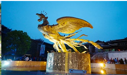
เมืองโบราณฟ่งหวง