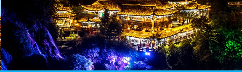
เมืองโบราณฝูหรงเจิน

วันที่สาม เมืองหยีซัง – เมืองจางเจียเจี๋ย – ตึกมหัศจรรย์ 72 ชั้น-ศูนย์แพทย์แผนจีน – เมืองโบราณฝูหรงเจิน