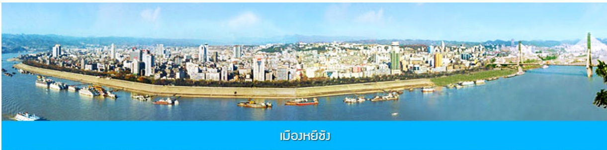
เมืองหยีซาง