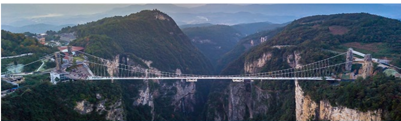
สะพานกระจากวางเวียจี้

อัตราค่าบริการสำหรับโปรแกรมเสริมการแสดงชุด The love Story of Wooden man and Fairy Fox ท่านละ 400 หยวน (หรือ 2,000 บาทขึ้นอยู่กับอัตราแลกเปลี่ยน) ระยะเวลาที่ใช้ในการเที่ยวชมการแสดง ประมาณ 3 ชั่วโมง รวมเวลาเดินทางไป กลับค่าบริการรวม ค่าบัตรเข้าชม ค่ารถรับ ส่ง และค่าน้ำดื่มของไกด์ท้องถิ่น พักที่ GUIYUANZHENPIN HOTEL โรงแรมระดับ 4 ดาวหรือเทียบเท่า