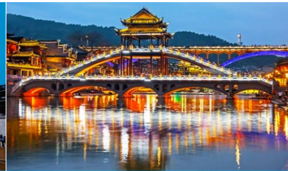
สะพานหงเจียว

วันที่ เที่ยวชมเมืองโบราณฝูหรงเจิ้น-เดินทางสู่เมืองโบราณฟ่งหวง- เที่ยวชมย่านเมืองเก่าเมืองโบราณฟ่งหวง