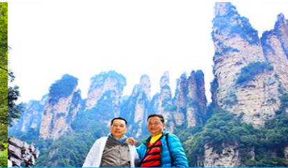
ชมจุดชมวิวลีฟท์แก้ว

วันที่ห้า เมืองจางเจียเจีย -เลือกซื้อโปรแกรมทัวร์เสริมออฟชั่น อุทยานอวตารจุดชมวิวจินเปียนซี-ชมจุดชมวิวลีฟท์แก้ว ร้านหยก- ร้านใบชา – เดินทางกลับเมืองหยีซัง