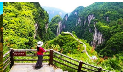
แก่น ปูจาสวรรค์

วันที่ 1 จางเจี๋ยเจี๋ย-พิพิธภัณฑภาพหินทราย –อุทยานไ้อ้อจ้าย-เมืองโบราณผู่หรงเจิ้น