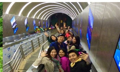
บันไดเลื่อนกะลุเกซา