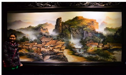
พิพิธภัณฑภาพหินทราย

อัตราค่าบริการสำหรับโปรแกรมเสริมการแสดงชุด The love Story of Wooden man and Fairy Fox ท่านละ 400 หยวน (หรือ 2,000 บาทขึ้นอยู่กับอัตราแลกเปลี่ยน) ระยะเวลาที่ใช้ในการเที่ยวชมการแสดง ประมาณ 3 ชั่วโมง รวมเวลาเดินทางไป กลับค่าบริการรวม ค่าบัตรเข้าชม ค่ารถรับ ส่ง และค่าน้ำที่วิวของไคด์ท้องถิ่น พักที่ ZHENMIN HOTEL โรงแรมระดับ 4 ดาวหรือเทียบเท่า