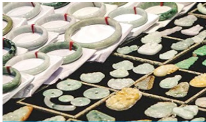
ศูนย์จำหน่ายผลิตภัณฑ์หยก

https://hk.trip.com/hotels/guzhang-hotel-detail-68614854/chaxitai-holiday-hotel/