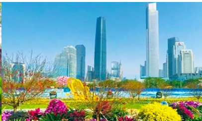
ไห่ซินซา