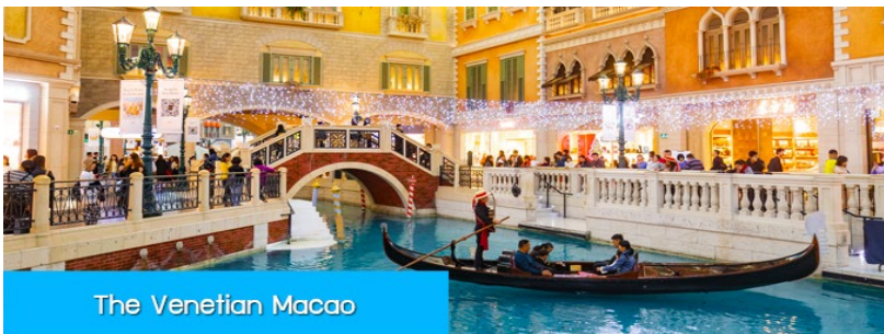
The Venetian Macao

จากนั้นนำท่านผ่านด่านกักเปี่ยเพื่อเดินทางสู่ เมืองมาเก๊า 澳門 เขตปกครองพิเศษที่อยู่ใต้สุดของจีน ที่ได้ชื่อว่าเป็น ลาสเวกัสของเอเชีย แหล่งรวมสถานบันเทิง คาสิโน โรงแรม รีสอร์ท และร้านจำหน่ายสินค้าแบรนด์เนมชั้นนำจากทั่วโลก อีกทั้งยังเป็นเมืองท่องเที่ยวยอดนิยมที่นักท่องเที่ยวทั่วโลกเดินทางมาเยือนปีละ 30 ล้านคน.. ข้ามสู่เมืองมาเก๊า