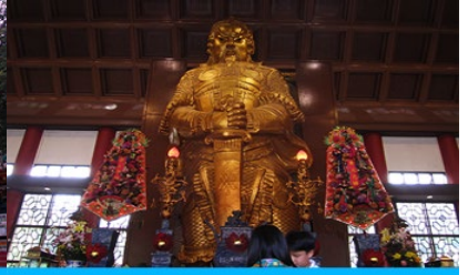
วัดเขกมเบียว