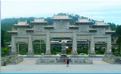
วัดผู้ถั่วซื่อ