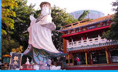
อ่าว Repulse Bay