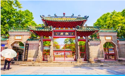
วัดจูเมี่ยว

23.00 น. คณะพร้อมกัน ณ ท่าอากาศยานสุวรรณภูมิ อาคารผู้โดยสารขาออก ชั้น 4 ประตู 10 เคาน์เตอร์สายการบิน 9AIR พบเจ้าหน้าที่บริษัทฯ คอยให้การต้อนรับและอำนวยความสะดวกด้านเอกสารและสัมภาระก่อนการเดินทาง