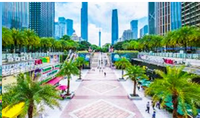
จตุรัสฮัวเจิง