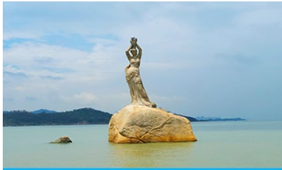
จูฬพีชชอริกรีล