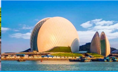
โรงละครจูไห่