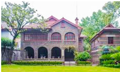
บ้านเกิดชุนยัตเซน

พักที่ IRVINE HOLIDAY HTL OR HUICHANG HTL 3* หรือโรงแรมในระดับเดียวกันในเมืองจูไห่