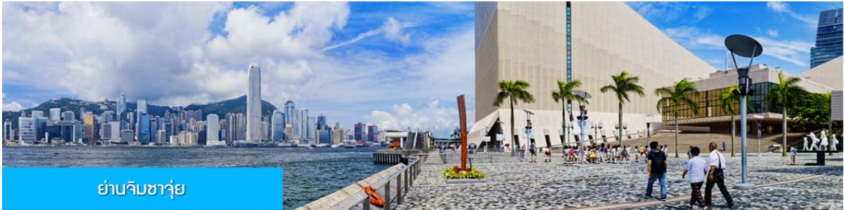
ย่านจิมซาจุ่ย