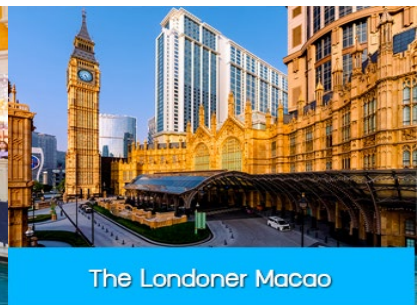
The Londoner Macao

นำคณะขึ้นรถ Shuttle Bus ของโรงแรมเดินทางสู่ เดอะปารีสเซียน มาเก๊า The Parisian Macao และ เดอะลอนดอนเนอร์ The Londoner Macao อัครสถานบันเทิงที่สร้างขึ้นเป็นดาวดวงใหม่ที่เจิดจรัสอยู่เหนือเกาะ