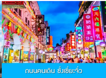
ถนนคนเดิน ชิวเซี่ยจิว