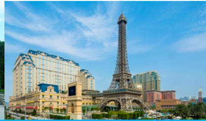
The Parisian Macao

วันที่สาม จูฬพีชชอริกรีล - รูปปั้นหญิงชาวประมง - วัดผู้ถั่วซื่อ - ศูนย์จำหน่ายหยก - มาเก๊า - เดอะปารีสเซียน - เดอะลอนดอนเนอร์ - เดอะเวเนเซียน - จูฬพีชชอริกรีล