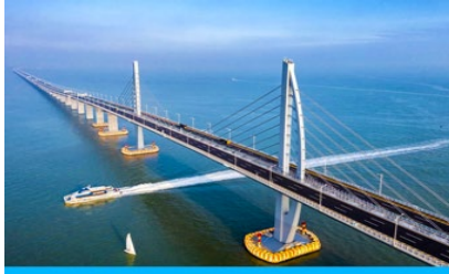
สะพาน ฮ่องกง จูไห่ มาเก๊า

พักที่ IRVINE HOLIDAY HTL OR HUICHANG HTL 3* หรือโรงแรมในระดับเดียวกันในเมืองจูไห่