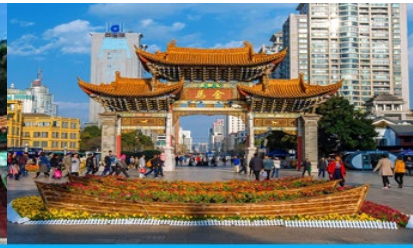
ขุมประตูปโบราณ ม้าทอง ไก่หยก

วันที่หก คุนหมิง - KUNMING WATERFALL PARK – ตำหนักทงจินเตียน - ขุมประตูปโบราณ ม้าทอง ไก่หยก - ร้าน POP MART (ตามหาลาบู้) - กรุงเทพฯ (สุวรรณภูมิ)