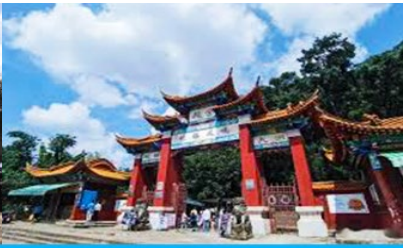
ตำหนักทงจินเตียน