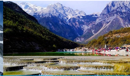
หุบเขาพระจันทร์สีน้ำเงิน "ไป๋ฮ่วยเหอ"

วันที่ 1 ภูเขาหิมะมังกรหยก (รวมนั่งกระเช้าใหญ่ขึ้นลง)– หุบเขาพระจันทร์สีน้ำเงิน-น้ำตกไป๋ฮ่วยเหอ ออฟชั่น ไกด์ชาวจีน 80 หยวน โชว์ IMPRESSION LIJIANG- อุทยานน้ำหยก -ต้าหลี่