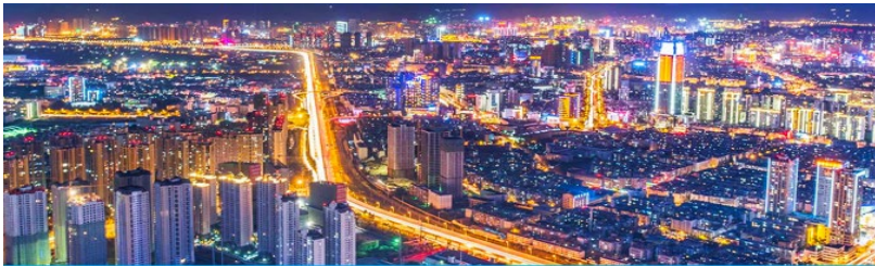
นครคุนหมิง