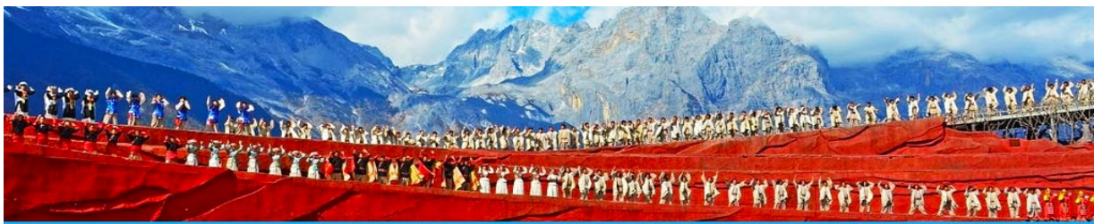
การแสดง IMPRESSION LIJIANG

หลังอาหารนำท่านชมการแสดง IMPRESSION LIJIANG โชว์อันยิ่งใหญ่โดยผู้กำกับชื่อก้องโลก “จาง อวิ๋หมว” ได้เนรมิต ให้ภูเขาหิมะมังกรหยกเป็นฉากหลัง และบริเวณทุ่งหญ้าเป็นเวทีการแสดง โดยใช้นักแสดงกว่า 600 ชีวิต แสง สี เสียง การแต่งกายตระการตา เล่าเรื่องราวชีวิตความเป็นอยู่ และชาวเผ่าต่างๆ ของเมืองลี่เจียง