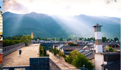
หมู่บ้านซีโจว(หมู่บ้านชาวปื)