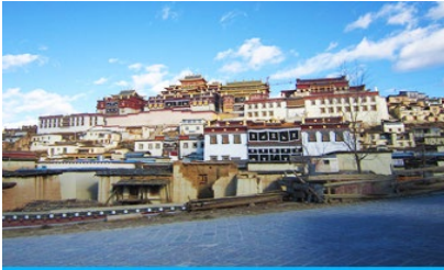
วัดลามะซวงเจียงหลิง

ที่พัก GRACE HOTEL ระดับ 4 ดาว หรือเทียบเท่าเมืองจางเจี๋ยน หรือเซงกรีล่า