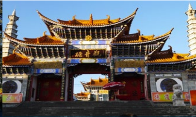
วัดเจ้าแม่กวนอิมแปลงกาย