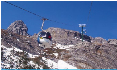
ภูเขาหิมะมังกรหยก (นั่งกระเช้าใหญ่)