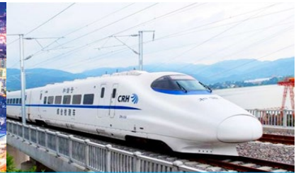
มังกรไฟความเร็วสูง