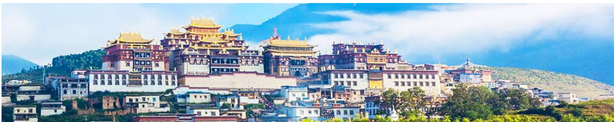
เมืองโบราณแชงกรีล่า

จากนั้นนำท่านชม หมู่บ้านซีโจวหรือหมู่บ้านชาวปื ชนพื้นเมืองที่สำคัญของเมือง ชมการแสดงของชนชาติปืพร้อมชิมชาสามแก้ว เพื่อรำลึกถึงวิถีชีวิตและการเกิดมาเป็นมนุษย์ของตนเอง ซึ่งถือเป็นเอกลักษณ์ของชนชาวปื ที่หาดูได้ยาก