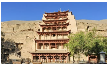
ถ้ำหินมั่วเกา

พักที่ METRO PARK HOTEL โรงแรมระดับ 4 ดาวหรือเทียบเท่าในเมืองตุนหวง