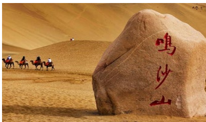
เนินทรายหมีงาช้าง