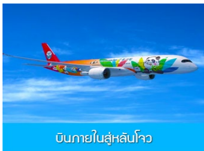
บินภายในสู่หลันโจว