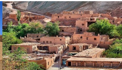
หมู่บ้านอุยกูร์