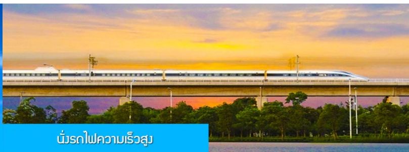
บริการไฟความเร็วสูง