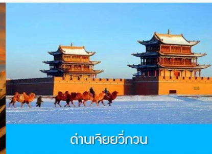
ด่านเจียวกวน