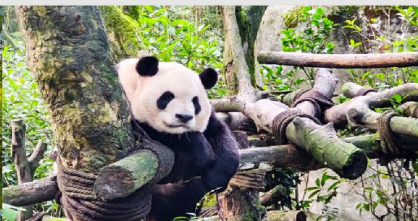
หุบเขาแพนด้าตุเจียงเอี้ยน