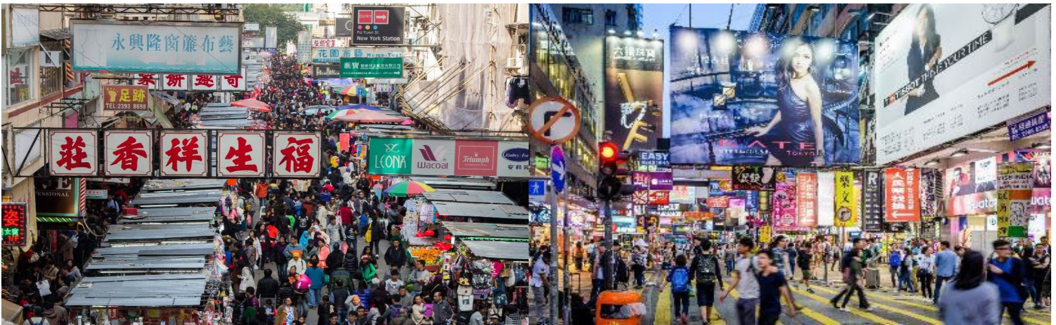
ค้า อิสระอาหารค้าเพื่อความสะดวกในการท่องเที่ยว

จากนั้นให้ท่านอิสระช้อปปิ้ง เลดี้มาร์เก็ต (Lady Market) อยู่ในย่านมงก๊ก เป็นถนนสายช้อปปิ้ง ถนนแต่ละสายจะมีพ่อค้าแม่ค้าที่ขายสินค้าเพียงประเภทเดียวเท่านั้น ทำให้สะดวกต่อการเลือกซื้อมากขึ้น ขายของหลากหลายตั้งแต่ เสื้อผ้าแฟชั่น เครื่องประดับ เครื่องสำอางค์ รองเท้าผ้าใบ เครื่องใช้ในครัว อุปกรณ์อิเล็กทรอนิกส์ เป็นต้น ที่นี้คุณสามารถซื้อและต่อรองราคาของได้เกือบทุกอย่าง