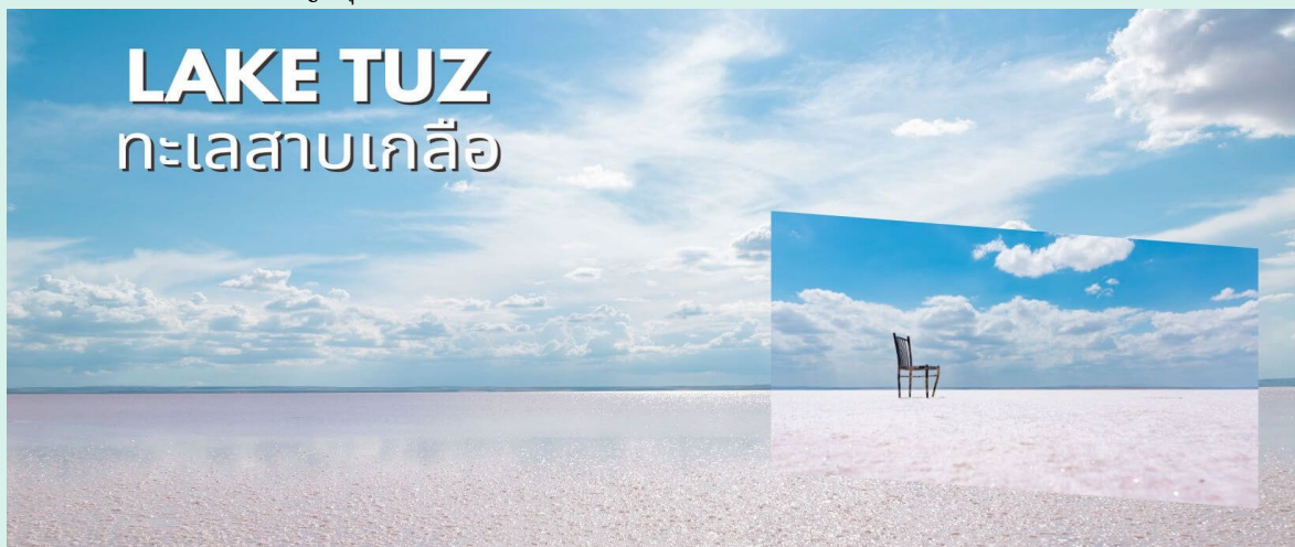
LAKE TUZ ทะเลสาบเกลือ

จากนั้นนำท่านเดินทางสู่ เมืองอังการ่า (ANKARA) เมืองหลวงของประเทศตุรเคีย เมืองที่ใหญ่เป็นอันดับสองรองจากอิสตันบูล มีความสำคัญทั้งทางธุรกิจและอุตสาหกรรม เป็นศูนย์กลางของรัฐบาลตุรเคียและเป็นที่ตั้งของสถานทูตประเทศต่างๆ ศูนย์กลางของการค้าขาย ให้ท่านอิสระพักผ่อนบนรถชมวิวเมืองระหว่างทางแวะถ่ายรูป ทะเลสาบเกลือ (LAKE TUZ) ทะเลสาบที่ใหญ่เป็นอันดับสองในตุรเคียและเป็นหนึ่งในทะเลสาบน้ำเค็มที่ใหญ่ที่สุดในโลก