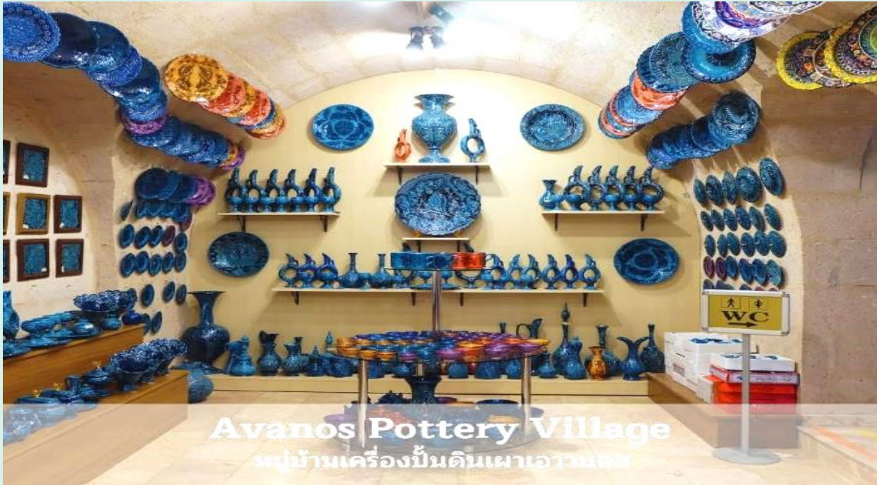
Avanos Pottery Village หมู่บ้านเครื่องปั้นดินเผาเอวานอส

เย็น รับประทานอาหารเย็น ณ ห้องอาหารของโรงแรม ที่พัก ➡ CAPPADOCIA HOTEL หรือเทียบเท่า