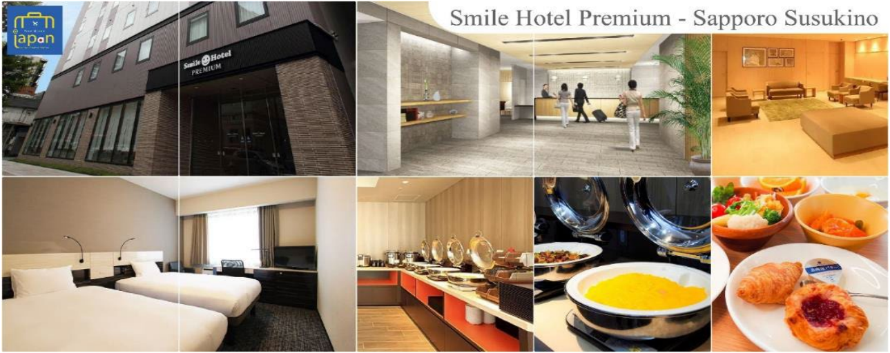
Smile Hotel Premium - Sapporo Susukino

รับประทานอาหารเย็น ณ ภัตตาคาร (3) พิเศษ!!! เมนู นูฟเฟต์ซามู + ซาบู SMILE HOTEL PREMIUM - SAPPORO SUSUKINO หรือเทียบเท่าระดับเดียวกัน