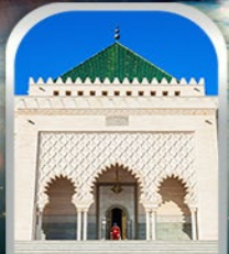
MOHAMMED V SQUARE