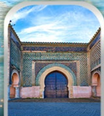
KASBAH OF MOULAY ISMAIL