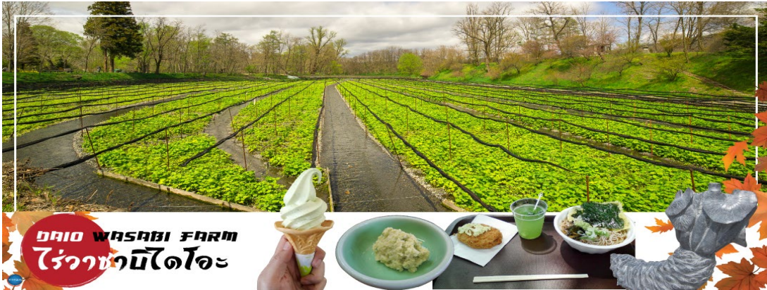
DAIO WASABI FARM ไร่วาซาบิไดโอะ

จากนั้นเดินทางสู่ ไร่วาซาบิไดโอะ (Daio Wasabi Farm) (ใช้เวลาเดินทางประมาณ 40 นาที) ไร่วาซาบิที่ใหญ่ที่สุดในญี่ปุ่น สัมผัสขั้นตอนการผลิต ที่ทางไร่ที่พิถีพิถันมากกว่าจะได้รู้ว่าวาซาบิส่งตรงมาถึงผู้บริโภคได้ ไร่แห่งนี้นับได้ว่าเป็นอีกหนึ่งแหล่งท่องเที่ยวธรรมชาติสายไร่ที่ใครได้ลองมาต้องติดอกติดใจ ด้วยทำเลที่ตั้งการที่ทางไร่ใช้น้ำบริสุทธิ์จากลำธารที่ไหลมาจากเทือกเขาทางทิศเหนือ ซึ่งช่วงเวลาที่เหมาะสมในการปลูกคือเดือนพฤษภาคมถึงเดือนตุลาคม ภายในนอกจากไร่วาซาบิแล้ว ยังมีร้านขายของ และร้านอาหารเปิดให้นักท่องเที่ยวได้เลือกซื้อผลิตภัณฑ์จากวาซาบิอีกด้วย ไม่ว่าจะเป็นวาซาบิสด วาซาบิ凍 โขะชะวาซาบิ แกงกะหรี่วาซาบิ ไส้กรอกวาซาบิ น้ำสลัดรสวาซาบิ เบียร์ที่ทำจากวาซาบิ น้ำวาซาบิ ไอศกรีมรสวาซาบิ ซ็อกโกแลตรสวาซาบิ และอื่นๆอีกมากมาย