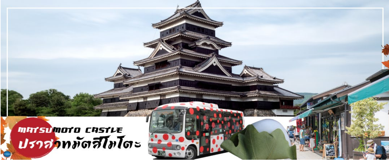
MATSUMOTO CASTLE ปราสาทมัตสึโมโตะ

เมืองมัตสึโมโตะ – ปราสาทมัตสึโมโตะ(ด้านนอก) – เมืองนากาโนะ – ไร่วาซาบิไดโอะ – เมืองเซกิ – พิพิธภัณฑ์มิดซันชู – เมืองนาโกย่า – ช้อปปิ้งย่านซาคาเอะ