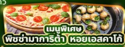
เมนูพิเศษ พิซซามากาเร็ตต้า หอยแอสคาโก้

บริการนำดื่มวินละ 1 ขวด ฟรี! ปลั๊กไฟยูนิเวอร์แซล