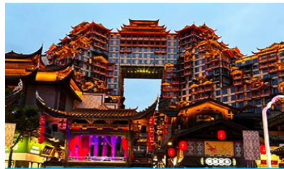
ตึกพิศวรรษย์ 72 ชั้น

พักที่ CHANGDE YUNXI HOTEL ระดับ 4 ดาวห้องถื่น หรือเทียบเท่าในเมืองฉางเต๋อ