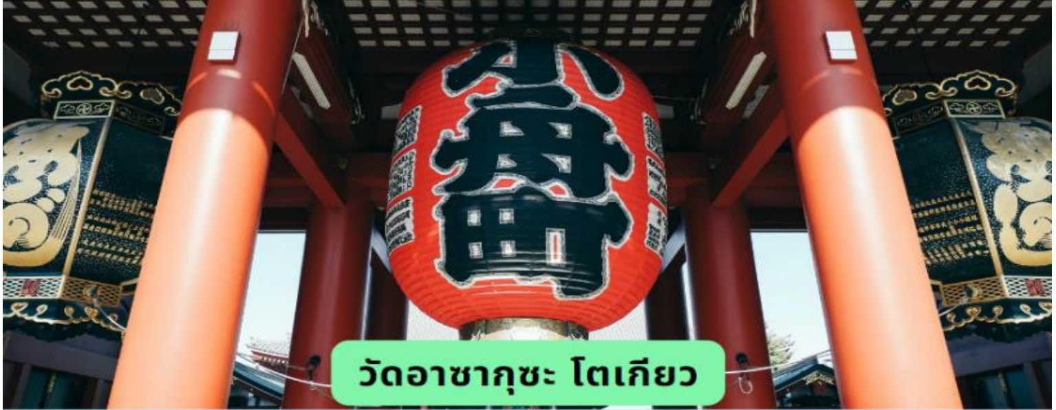
วัดอาซากุสะ โตเกียว