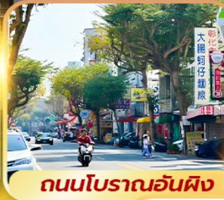
ถนนโบราณอันผิง