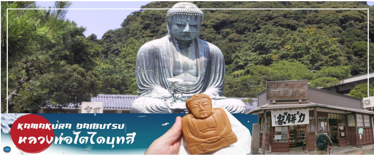
KAMAKURA DAIBUTSU หลวงหัวโตไดบุทสึ

วันที่สอง ท่าอากาศยานนานาชาตินาริตะ – เมืองนาริตะ – เมืองคามาคุระ – ศาลเจ้าสิริงะโอะกะ สะจิมัง – ถนนโคมาจิโดริ – พระใหญ่ไดบุทสึคามาคุระ – เมืองคานากาวะ – เทศกาลประดับไฟซากะมิโกะ – เมืองยามานาชิ – ออนเซ็น + ชาบูยักษ์