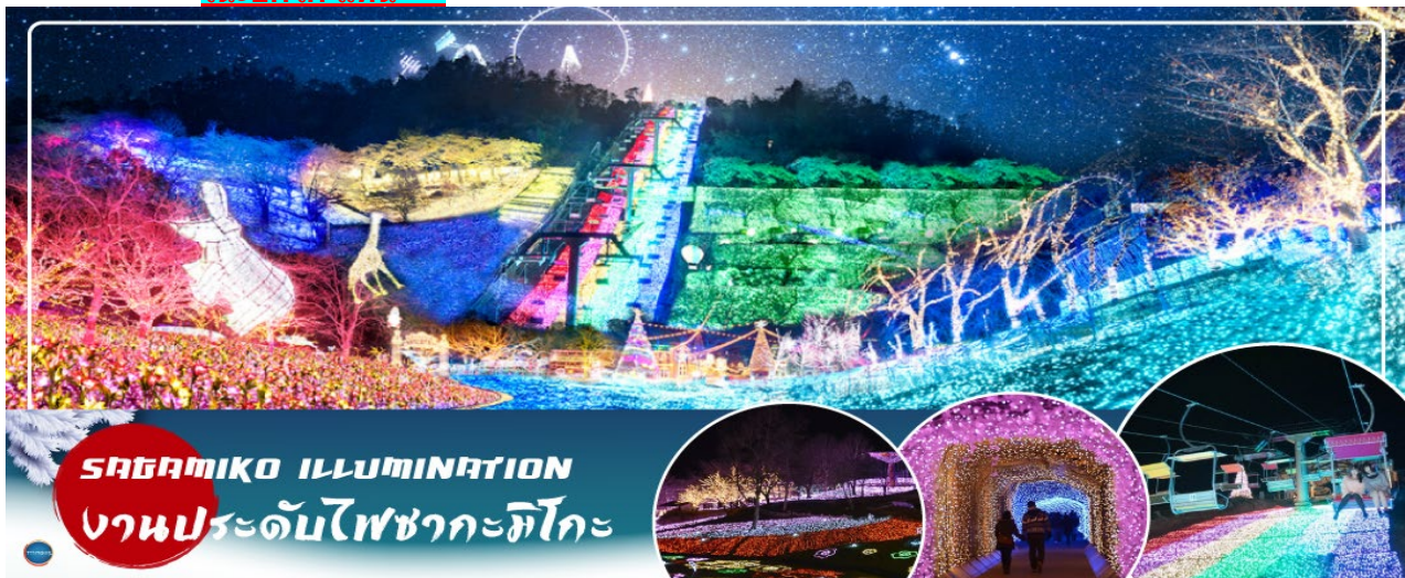
SAGAMIKO ILLUMINATION งานประดับไฟซากะมิโกะ

** ปกติงานประดับไฟซากะมิโกะ จะปิดทำการทุกวันพรและพห้สบดี อ้างอิงจากงานประดับไฟของปี 2023 - 2024 กรณีที่กรุ๊ปเดินทางเข้าชมตรงวันหยุดของงานประดับไฟซากะมิโกะ ขอปรับเปลี่ยนโปรแกรมเป็น งานประดับไฟที่หมู่บ้านเยอรมัน (Tokyo german village) หอดเพนในวันถัดไป และที่เที่ยววันนี้จะเป็น หมู่บ้านโอชิโนะฮักไก แทน **