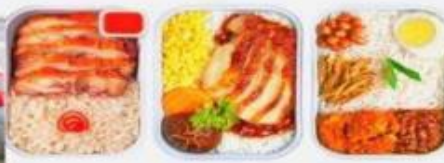
บริการอาหารร้อน ทั้งขาไป-ขากลับ