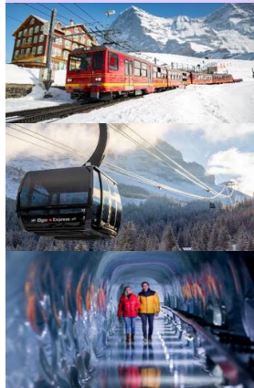
เมืองกรินเดลวัลด์

นำท่านเดินทางสู่ เมืองกรินเดลวัลด์ (Grindelwald) (เดินทางประมาณ 1 ชม.) เมืองตากอากาศเล็กๆแสนสวยงามของประเทศสวิตเซอร์แลนด์ เป็นที่ตั้งของ สถานีรถไฟกรินเดลวัลด์ (Grindelwald Terminal Station) นำท่านนั่ง เคเบิลคาร์ Eiger Express พิชิตยอดเขาจุงเฟรา เปลี่ยนขบวนรถไฟที่ สถานีรถไฟไเกอร์เกลท์เชอร์ มีความสูงกว่าระดับน้ำทะเลถึง 11,333 ฟุตหรือ 3,454 เมตร ขึ้นสู่ยอดเขาสถานีปลายทางสถานีรถไฟจุงเฟรายอร์ก สถานีรถไฟที่สูงที่สุดในทวีปยุโรป เดินทางถึง ยอดเขาจุงเฟรา (Jungfrau / Top of Europe) หนึ่งในยอดเขาที่สูงที่สุดในเทือกเขาแอลป์ ได้รับการขึ้นทะเบียนให้เป็นมรดกโลกโดยยูเนสโก นำท่านเข้าชม ถ้ำน้ำแข็งพันปี (Ice Palace) เป็นถ้ำน้ำแข็งพันปีที่ไม่มีวันละลาย เกิดจากการขุดเจาะใต้ธารน้ำแข็ง Glacier ลึกลงไป 30 เมตร ภายในจะมีผลงานศิลปะเป็นน้ำแข็งแกะสลักอยู่ตามจุดต่างๆ และ ลานสฟิงซ์ จุดชมวิวที่สูงที่สุดในยุโรปที่ระดับความสูงถึง 3,571 เมตร สามารถมองเห็นได้กว้างไกลที่ถึงชายแดนของประเทศสวิตเซอร์แลนด์ สัมผัสกับภาพของ ธารน้ำแข็ง (Aletsch Glacier) ที่ยาวที่สุดในเทือกเขาแอลป์ มีความยาวถึง 22 กิโลเมตรและความหนาถึง 700 เมตร โดยไม่เคยละลาย อีสระให้ท่านได้เพลิดเพลินกับการถ่ายรูปและกิจกรรมบนยอดเขาที่ไม่ควรพลาดกับการส่งโปสการ์ดโดย ที่ทำการไปรษณีย์ที่สูงที่สุดในยุโรป