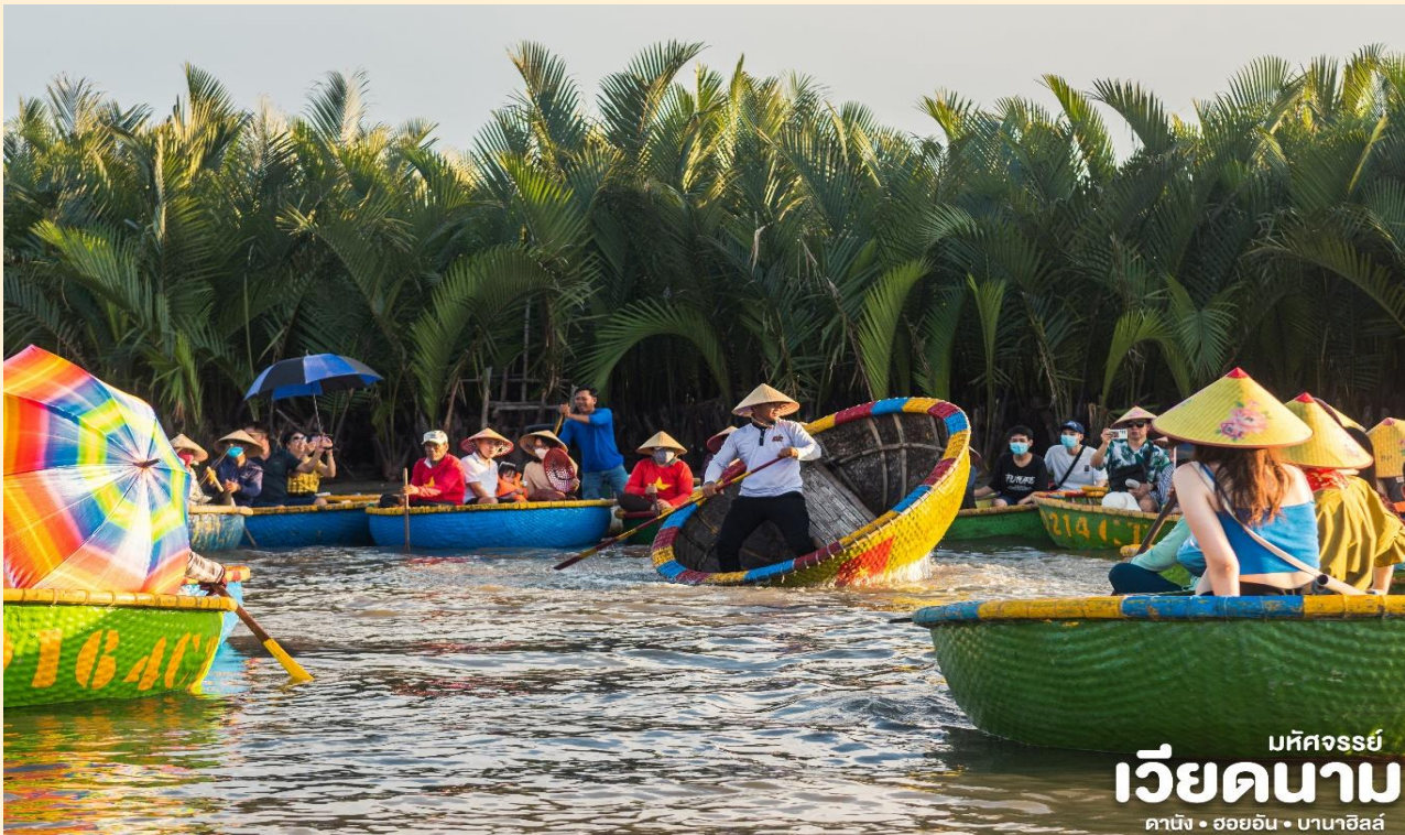
มหัศจรรย์ เวียดนาม คาบัง • ฮอยอัน • บานาฮิลล์

เดินทางสู่ หมู่บ้านกัมทาน สนุกสนานไปกับกิจกรรม!! นั่งเรือกระดังCam Thanh Water Coconut Village หมู่บ้านเล็กๆในเมืองฮอยอันตั้งอยู่ในสวนมะพร้าวริมแม่น้ำ ในอดีตช่วงสงครามที่นี่เป็นที่พักอาศัยของเหล่าทหาร อาชีพหลักของคนที่นี่คืออาชีพประมง ระหว่างการล่องเรือท่านจะได้ชมวัฒนธรรมอันสวยงาม ชาวบ้านจะขับร้องเพลงพื้นเมือง ผู้ชายกับผู้หญิงจะหยอกล้อกันไปมานำที่พายเรือมาเคาะกันเป็นจังหวะดนตรีสุดสนุกสนาน (ไม่รวมค่าทิปคนพายเรือ ท่านละ 50 บาท/ต่อท่าน/ต่อทริป)