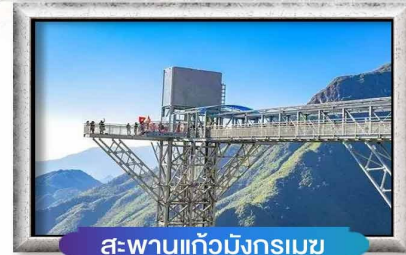
สะพานแก้วมังกรเมฆ