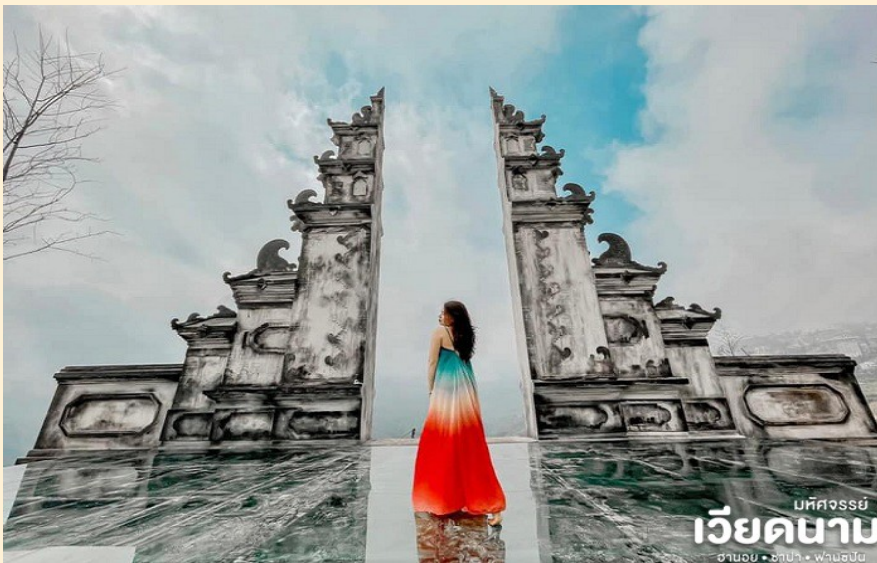
มหัสจรรย์ เวียดนาม ฮานอย • ซาปา • ฟานซิปัน

นำท่านสู่ โมอาน่า (Moana Sapa Cafe) จุดเช็คอินแห่งใหม่ของเมืองซาปาคัล้ายกับประตูสวรรค์ ที่บาทลีให้ท่านได้ถ่ายรูปเก๋ๆกับมุมน่ารักๆ ที่เมื่อมองไปด้านหลังจะเห็นเป็นวิวภูเขาอันสวยงาม นอกจากนี้ยังมีเครื่องดื่มจำหน่าย ให้ท่านได้อิสระกับบรรยากาศสุดฟิน