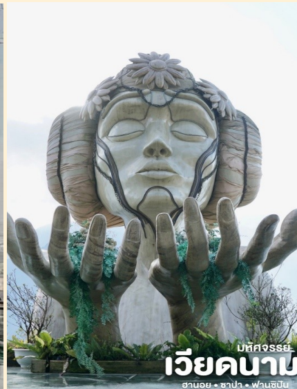
มหัสจรรย์ เวียดนาม ฮานอย • ซาปา • ฟานซิปัน