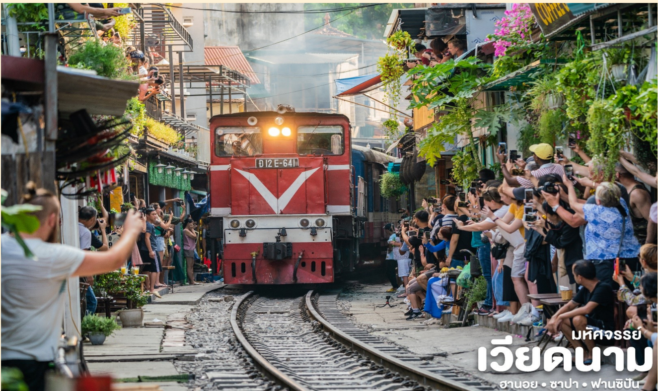
มัทศวรรษ เวียดนาม ฮานอย • ซาปา • ฟานซิปัน

เดินทางสู่ อีกหนึ่งไฮไลท์ที่ต้องมาแวะ ทางรถไฟฮานอย หรือ Ha Noi Train Street เป็นชุมทางรถไฟที่มีอายุกว่า 100 ปีวิ่งผ่าน ตั้งอยู่ในตรอกแคบๆ ย่าน Old Quarter สามารถนั่งมองรถไฟวิ่งผ่านอย่างใกล้ชิด มีคาเฟ่ เครื่องดื่มขาย และก่อนรถไฟมาประมาณ 10 นาที จะมีพนักงานเจ้าหน้าที่คอยบอกให้เรายืนอยู่ภายในเส้นที่ปลอดภัย ถือเป็นอีกประสบการณ์ใหม่ๆที่ได้ชมรถไฟอย่างใกล้ชิด