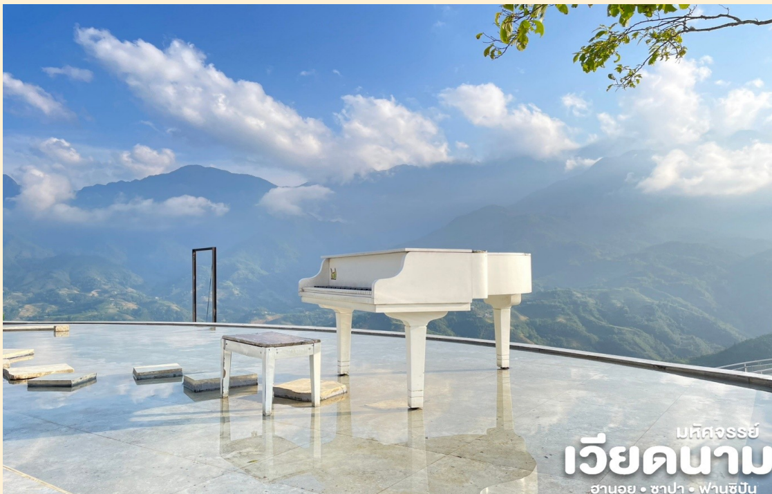
มหัสจรรย์ เวียดนาม ฮานอย • ซาปา • ฟานซิปัน