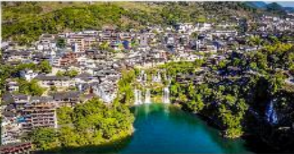
เมืองโบราณฝูหรงเจิน