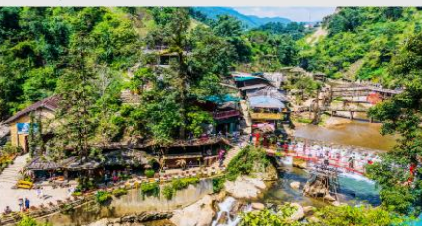
หมู่บ้าน Cat Cat