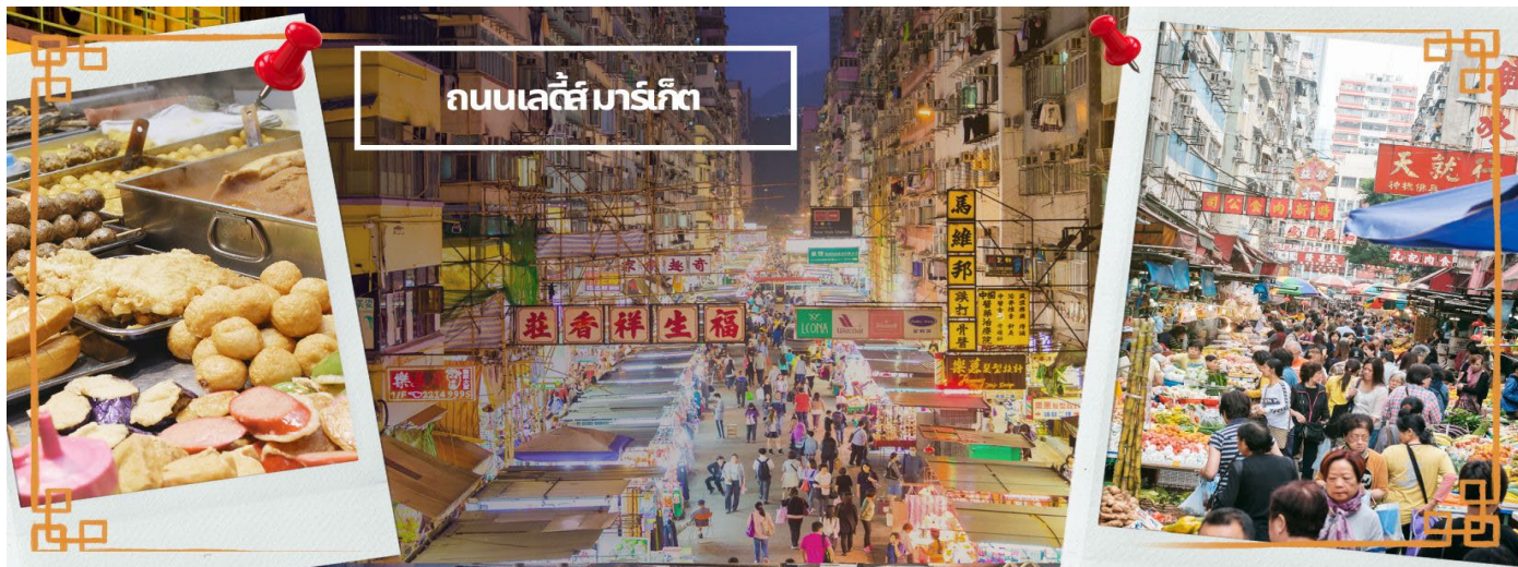
ถนนเลดี้มาร์เก็ต

สมควรแก่เวลานำคณะออกเดินทางสู่สนามบินฮ่องกง