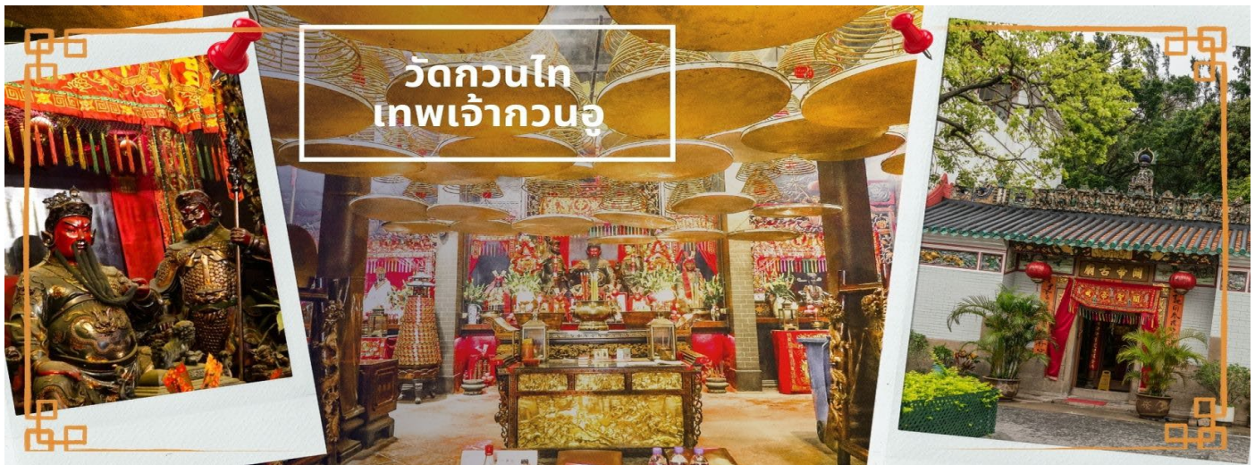
วัดกวนไท เทพเจ้ากวนอู

จากนั้นนำท่านเดินทางสู่ วัดกวนไท เป็นสถานศักดิ์สิทธิ์อันเลื่องชื่อ ถือว่าเป็นวัดแห่งเดียวในเขตเกาลูน ที่สร้างขึ้นเพื่อบูชา เทพเจ้ากวนอู ซึ่งท่านเป็นเทพเจ้าแห่งความซื่อสัตย์ เปี่ยมไปด้วยคุณธรรม โดยศาลเจ้าพ่อกวนอู แห่งนี้ ผู้ที่มาไหว้สักการะจะนิยมขอพรเรื่องธุรกิจและบิรวาร เนื่องจากว่าเจ้าพ่อกวนอู เป็นเทพเจ้าที่รักษาคำพูด ด้วยชีวิต รักคุณธรรม ซื่อสัตย์ ช่วยปกป้องสิ่งเลวร้าย อันตรายต่าง ๆ และช่วยเสริมอำนาจบารมีในการปกครอง ท่านมีจิตใจมั่นคงตั้งชุนเขา มีสติปัญญาเป็นเลิศ และไม่ประมาท ท่านจึงเป็นสัญลักษณ์แห่งความเข้มแข็งโดดเด่น เดี่ยว ไม่ครั้นคร้ามต่อศัตรู ฉะนั้นการมาบูชาขอพรท่าน จะช่วยเสริมดวงไม่ให้เปลี่ยงพล้ำแก่ศัตรู ทำให้มีมิตรที่ซื่อสัตย์ และคุ้มครองบิรวารให้ก้าวหน้าและอยู่เย็นเป็นสุข ซึ่งผู้ประกอบการอาชีพ ตำรวจ ทหาร และ นักการเมือง จึงมักจะนิยมบูชาเทพเจ้ากวนอู เป็นพิเศษ