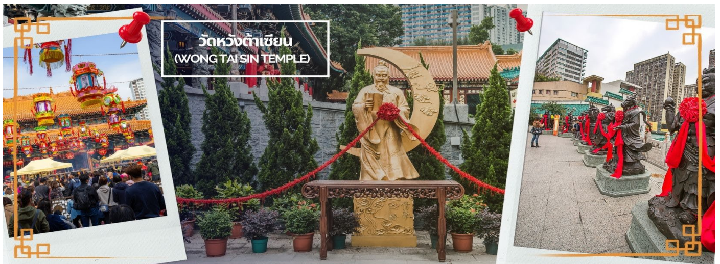
ผูกด้ายดวงชะตา ระหว่างคู่รักซึ่งเมื่อคู่กันแล้วก็จะไม่แคล้วคลาดกัน

และยังถ่ายทอดวิชาให้กับลูกศิษย์มากมาย จนได้รับยกย่องว่าเป็นเทพหว่องไท่ซิน และได้ตั้งศาลหว่องไท่ซิน เอาไว้ เพื่อกราบสักการะ นอกจากนั้นแล้ว ภายในวัดยังมี เทพเจ้าด้ายแดง หรือเทพเจ้าหุคโหลว รูปปั้นสีทอง มี เลี้ยวพระจันทร์อยู่ด้านหลัง เป้าหมายของคนโสดอยากมีคู่!!! โดยการขอพรกับเทพเจ้าองค์นี้ต้องใช้ด้ายแดง ผูกนิ้วเอาไว้ไม่ให้หลุดระหว่างพิธี เพราะชาวจีนเชื่อว่าด้ายแดงนี้แหละคือ เส้นโยงโชคชะตาด้านความรัก คนโสด ก็เป็นการขอพรให้เจอเนื้อคู่ ส่วนคนมีคู่ ก็จะช่วยทำให้มีความรักที่มั่นคงและยืนยาว เมื่อไปถึงจะเห็นรูปปั้นของ เทพหุคโหลวอยู่ตรงกลาง เมื่อหันหน้าเข้าหาเทพหุคโหลว จะพบรูปปั้นเจ้าบ่าว อยู่ทางขวา และรูปปั้นเจ้าสาว อยู่ทางซ้าย โดยมีด้ายแดงผูกโยงจากเจ้าบ่าวและเจ้าสาวมาที่เทพหุคโหลว ซึ่งท่านจะคอยทำหน้าที่จดรายชื่อ คู่รัก เชื่อกันว่าสมุดที่ผู้เฒ่าถือในมือ คือบัญชีรายชื่อคู่รักที่จะได้รับคำอวยพรให้อยู่คู่กันอย่างร่มเย็นเป็นสุข ซึ่งจะ ปรากฏด้วยยามค่ำคืนภายใต้แสงจันทร์ เป็นเทพเจ้าผู้เป็นอมตะที่อาศัยอยู่บนดวงจันทร์ และลงมาโลกมนุษย์เพื่อ