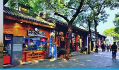
ซอยหนานหลั่วกู่เซียง