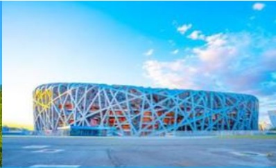
สนามกีฬาโอลิมปิก