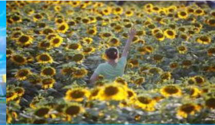
ดอกทานตะวันในสวนโอลิมปิก