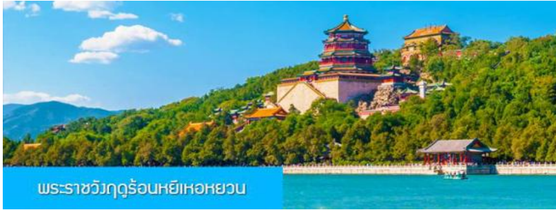
พระราชวังฤดูร้อนหยี่เหอหยวน