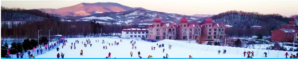
ลานสกียาบูลิ

พักที่ HARBIN REZEN HOTEL โรงแรมระดับ 4 ดาวท้องถิ่นหรือเทียบเท่า ในเมืองฮาร์บิน