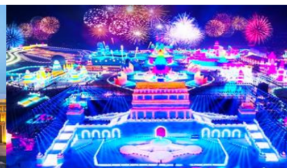
เทศกาลแกะสลักน้ำแข็งนานาชาติ

วันที่สอง เมืองต้าเหลียน-รถไฟความเร็วสูงสู่เมืองฮาร์บิ้น-เมืองฮาร์บิ้น-ศูนย์จำหน่ายอุปกรณ์กันหนาว-ตุ๊กตาทิมะยักษ์ - เที่ยวชมงานเทศกาลแกะสลักน้ำแข็งนานาชาติ