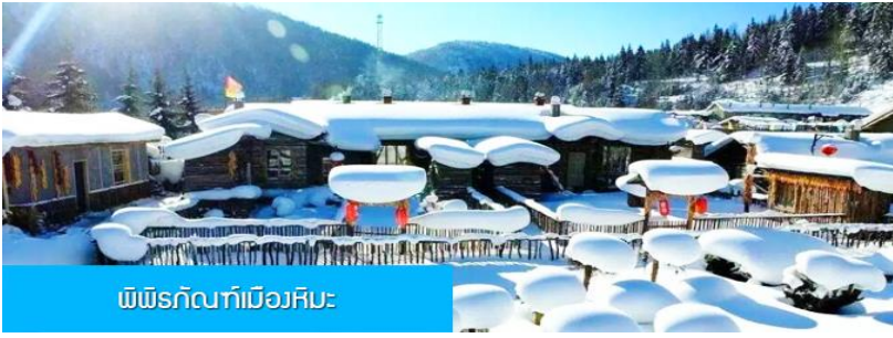
พิพิธภัณฑ์เมืองหิมะ