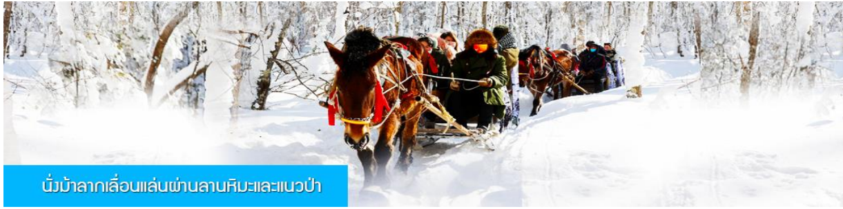
นั่งม้าลากเลื่อนเล่นผ่านลานหิมะและแนวป่า

รายการที่ 2 นั่งม้าลากเลื่อนผ่านลานหิมะและแนวป่า 马拉雪橇 ท่ามกลางสิ่งแวดล้อมของหิมะราวกับอยู่ในโลกแห่งเทพนิยาย ผ่านหมู่บ้าน เว่ยหู่จ้าย 威虎寨 ที่อดีตเคยเป็นที่ตั้งของรังโจรที่มักออกปล้นสะดมชาวบ้าน ม้าลากเลื่อนเป็นยานพาหนะเฉพาะพื้นที่ ๆ ได้รับความนิยมนมากในอดีต การเดินทางในช่วงฤดูหนาวต้องใช้ม้าลากจูงลากเลื่อนให้สามารถวิ่งผ่านบนลานหิมะได้ โดยลากเลื่อนที่มีม้าเป็นตัวลากจูงสามารถลำเลียงได้ทั้งผู้คน และข้าวของเสบียงต่าง ๆ ...เวลาที่ใช้สำหรับโปรแกรมเสริมนี้ประมาณ 40 นาที อัตราค่าบริการ ท่านละ 240 หยวน หรือ 1200 บาท อัตรานี้รวมค่าบริการผ่านเข้าอุทยาน ค่ารถรับ ส่ง และค่าบริการของไกด์ท้องถิ่น และค่าบริการจัดการของบริษัททัวร์ท้องถิ่น... หมายเหตุ โปรแกรมเสริมเป็นโปรแกรมที่ท่านต้องเสียค่าใช้จ่ายเองด้วยความสมัครใจ สำหรับท่านที่ไม่เข้าร่วมกิจกรรมดังกล่าวสามารถนั่งพักในรถได้