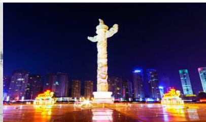
จัตุรัสชิงไห่