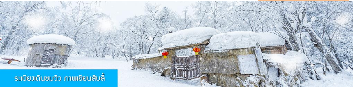
ระเบียงเดินชมวิว ภาพเขียนสิบลิ้

ระหว่างทางใกล้ท้องถนนจะเสนอขายโปรแกรมเสริมที่ไม่ได้รวมในค่าทัวร์ (ออฟชั่นแนล ทัวร์) 2 รายการ