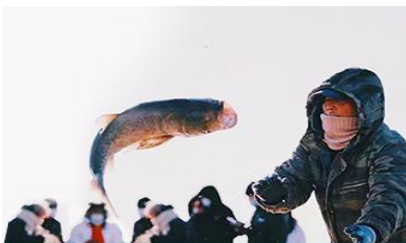
การจับปลาในฤดูหนาว

นำท่านชม การจับปลาในฤดูหนาว 冬捕 เป็นวิธีการจับปลาตามแม่น้ำและแหล่งน้ำในฤดูหนาวที่สืบทอดกันมายาวนาน โดยชาวบ้านจะนำแหดักปลาวางดักไว้ตามจุดต่าง ๆ ก่อนที่ผิวน้ำจะปกคลุมด้วยน้ำแข็ง หลังจากผิวน้ำกลายเป็นน้ำแข็งแล้ว ชาวบ้านจะเจาะพื้นน้ำแข็งบริเวณที่มาวางดักอยู่เพื่อยกแหขึ้น จะมีปลาติดแหเป็นจำนวนมาก...พิเศษ ให้ท่านได้ชมการยกแหดักปลาจากสถานที่จริง และให้ท่านได้ชิมซูชิเนื้อปลาสด ๆ ที่ได้จากแหดักปลา