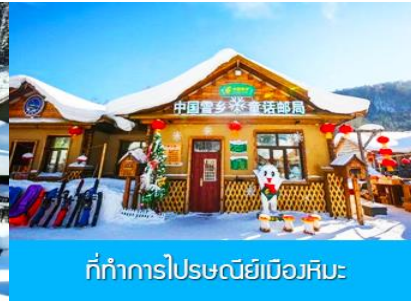
ที่ทำการไปรษณีย์เมืองหิมะ

วันที่สี่ พิพิธภัณฑ์เมืองหิมะ – ที่ทำการไปรษณีย์เมืองหิมะ – ใกล้เคียงออฟชั่นภาพเขียนสิบลิ้-และออฟชั่นม้าลากเลื่อน-เมืองฮาร์บิ้น