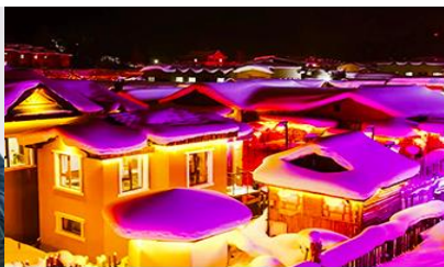
เมืองหิมะ Xue xiang