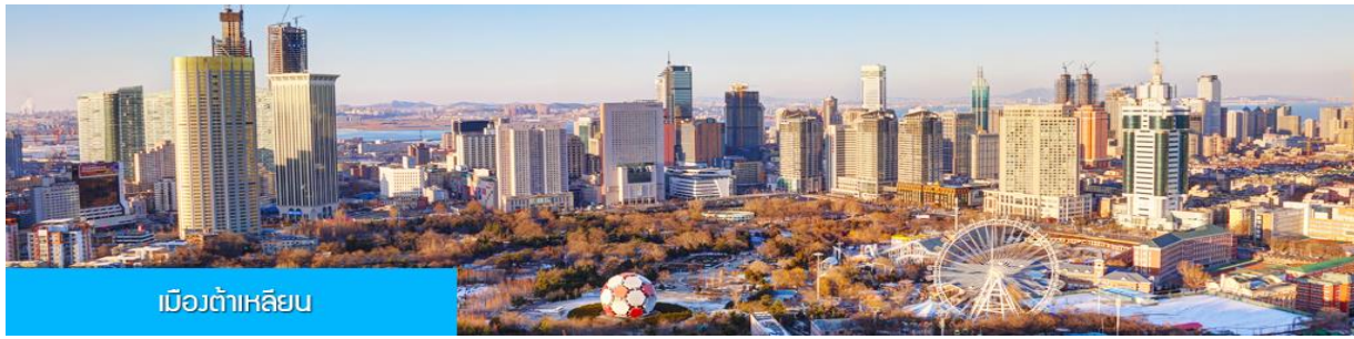
เมืองต้าเหลียน