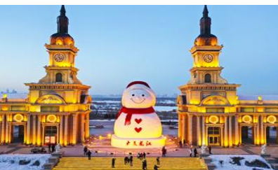
ตุ๊กตาทิมะยักษ์