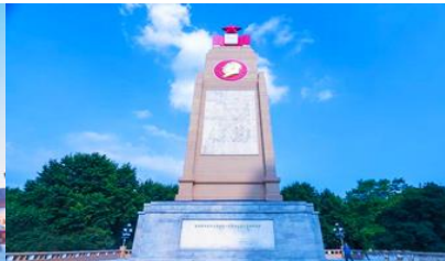
อนุสาวรีย์พิงหว