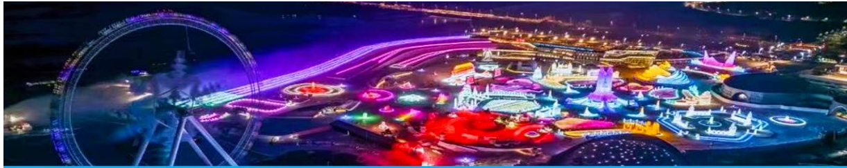
เทศกาลแกะสลักน้ำแข็งนานาชาติ

หลังอาหารนำท่านเที่ยวชมงาน เทศกาลแกะสลักน้ำแข็งนานาชาติ 冰雪大世界 Harbin 2025 International Ice and Snow Festival งานนิทรรศการการและศิลปกรรมการแกะสลักนานาชาติประจำปีที่ยิ่งใหญ่และอลังการ ด้วยสภาพอากาศที่หนาวเย็นในช่วงฤดูหนาวของเมืองฮาร์บิ้น ที่นี้ได้กลายเป็นลานประกวดประติมากรรมน้ำแข็งกลางแจ้งที่ใหญ่และมีชื่อเสียงที่สุดของโลก ให้ท่านได้เดินเที่ยวชมความสวยงาม ตระการตาของประติมากรรมน้ำแข็งที่ประดับด้วยแสงสีตามอัชฌาศัย.....จนสมควรแก่เวลา นำท่านเดินทางกลับโรงแรม (งานเทศกาลคาดการณ์เปิดวันที่ 15 ธันวาคม 2024 และ จะปิดวันที่ 28 กุมภาพันธ์ 2025)