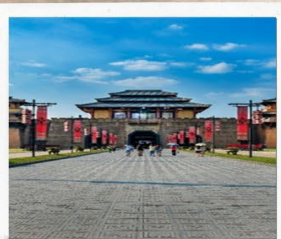
Hengdian World Studio