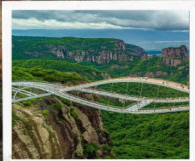
สะพานหลูอี้