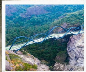
สะพานมังก