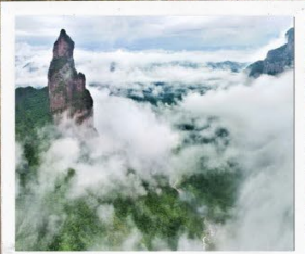
อุทยานเส้นเซียนจวี