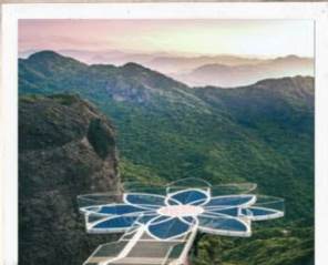
สะพานบัวสวรรค์