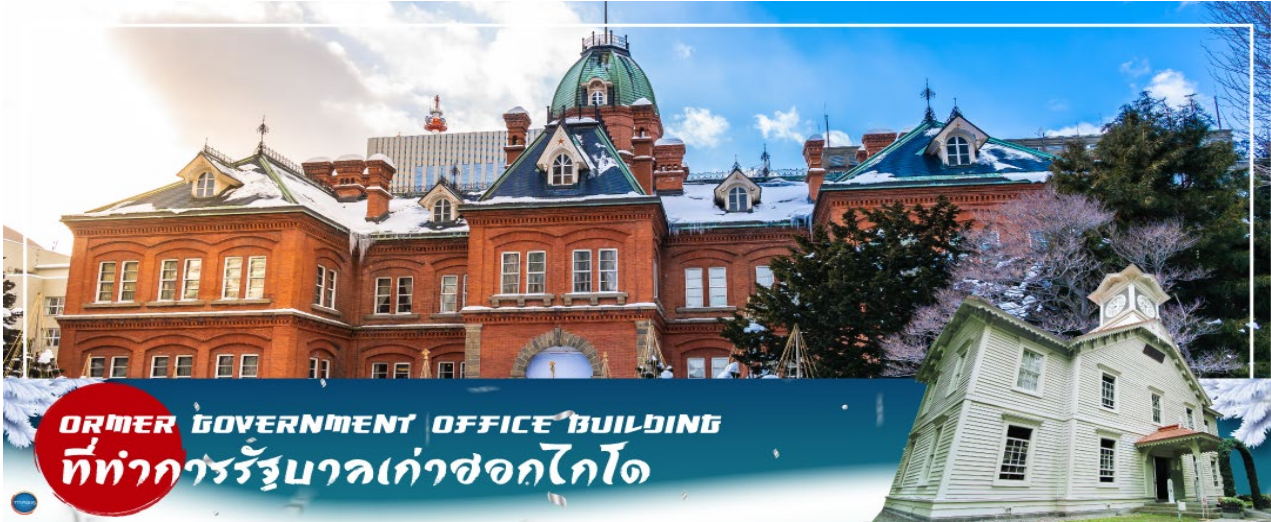
FORMER GOVERNMENT OFFICE BUILDING ที่ทำการรัฐบาลเก่าซอกไกโด

วันที่สาม เมืองซัปโปโร – ดิวตี้ฟรี – ผ่านชม ศาลว่าการเมืองซอกไกโดหลังเก่า – ผ่านชม หอนาฬิกาเมืองซัปโปโร – เมืองอาซาฮิคาว่า – โชซอนเคียว – ภูเขาคุโรดากะ (นั่งกระเช้า)** ขึ้นอยู่กับสภาพอากาศ** – ออนเซน