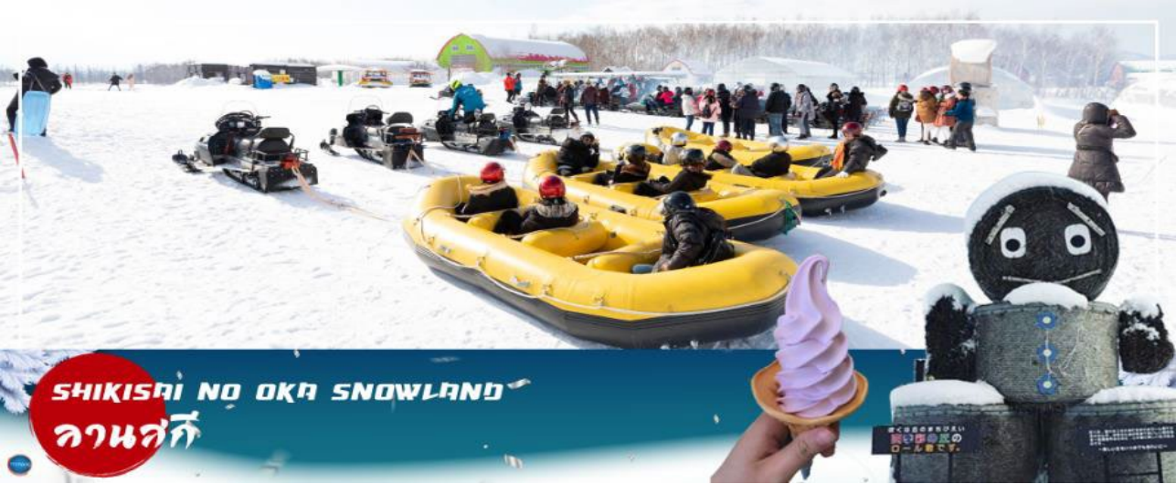
SHIKISAI NO OKA SNOWLAND ลานสกี

เมืองอาซาฮิคาว่า – เมืองฟูราโนะ – ลานสโนว์ เวิลด์ (กิจกรรมทางหิมะ) – หมู่บ้านเทพนิยาย นิงเกิลเทอเรส – เมืองซัปโปโร – ถนนช้อปปิ้งทานุกิโจจิ