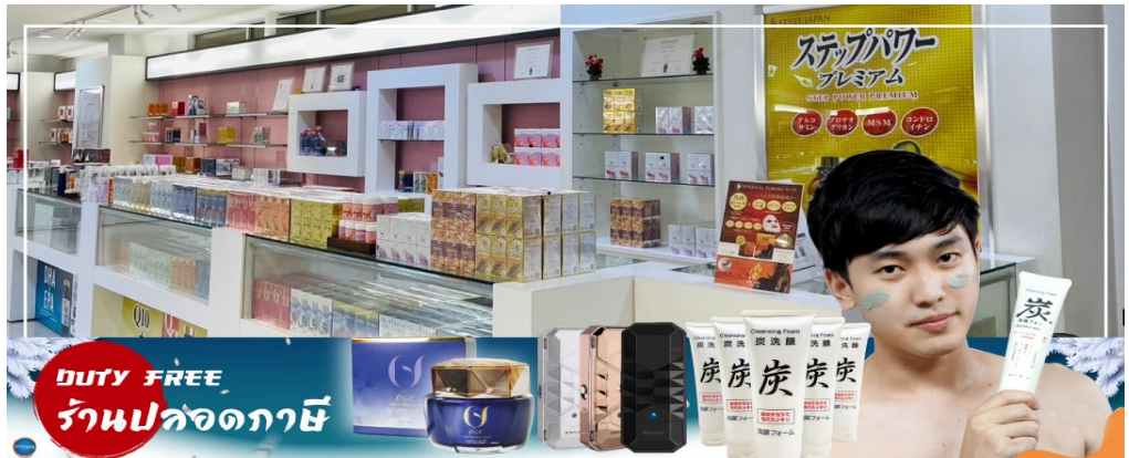
DUTY FREE ร้านปลอดภาษี

จากนั้นเดินทางสู่ เมืองอาซาฮิคาว่า (Asahikawa) (ใช้เวลาเดินทางประมาณ 2.30 ชั่วโมง) เป็นเมืองใหญ่อันดับ 2 ของจังหวัดซอกไกโด รองจากเมืองซัปโปโร เป็นเมืองศูนย์กลางทางตอนเหนือของเกาะ ล้อมรอบด้วยเทือกเขาไดเซตสึชันและแม่น้ำน้อยใหญ่ มีแหล่งท่องเที่ยวยอดนิยมอยู่หลายแห่ง