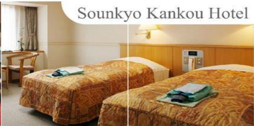
Sounkyo Kankou Hotel