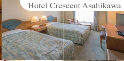
Hotel Crescent Asahikawa