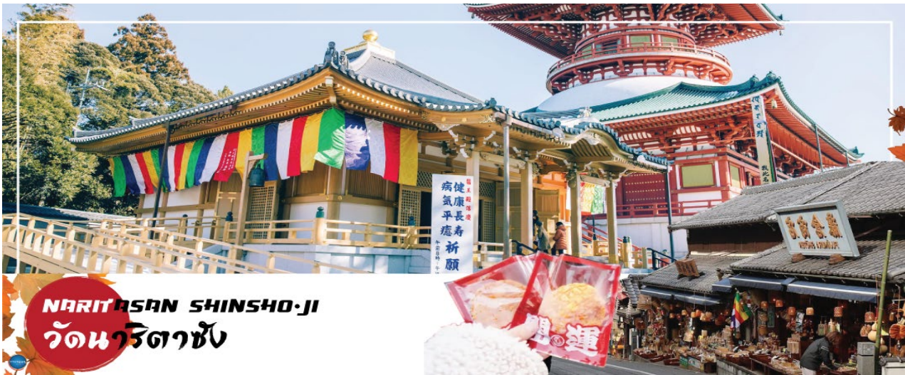
NARITASAN SHINSHO-JI วัดนาริตาซัง

วันที่ห้า เมืองนาริตะ – วัดนาริตะชิน – ถนนปลาไหล โอโมเตะซังโตะ – กรุงโตเกียว – ตลาดปลาซึกิจิ – ชมแมวยักษ์3มิติ พร้อมช้อปปิ้งย่านชินจูกุ – เมืองนาริตะ