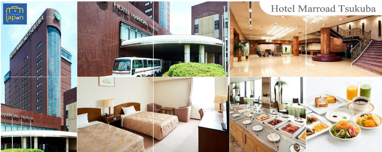
Hotel Marroad Tsukuba

รับประทานอาหารเย็น ณ ภัตตาคาร (1) HOTEL MARROAD, TSUKUBA หรือระดับเดียวกัน