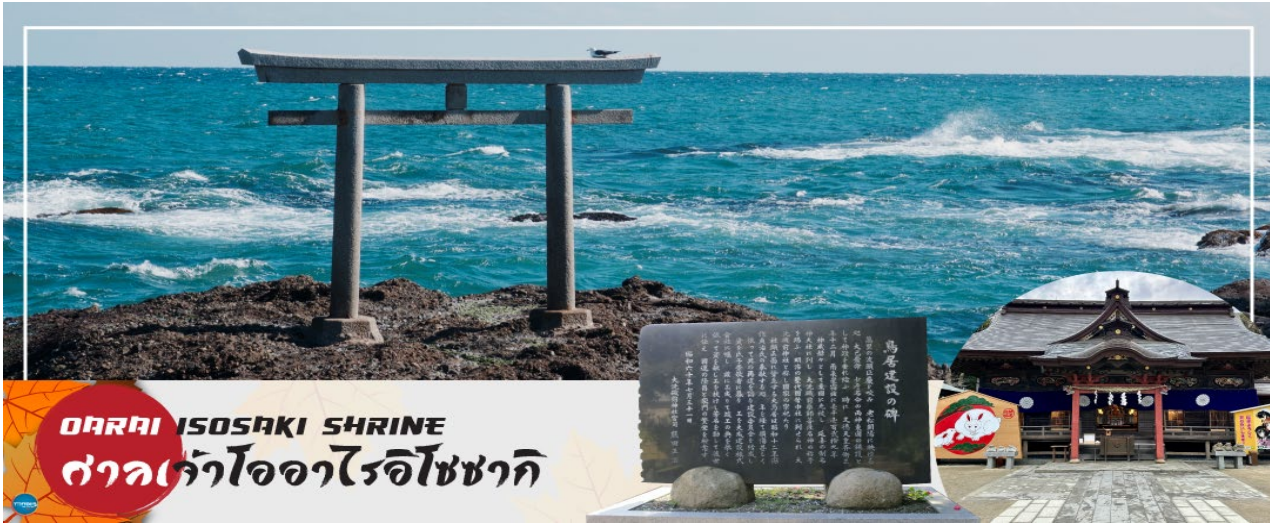
Ososaki Shrine ศาลเจ้าโออัสากิ

พระอาทิตย์ขึ้นที่มีชื่อเสียง มีนักท่องเที่ยวมากมายมาเฝ้าคอยเพื่อเก็บภาพช่วงเวลาแสงตะวันสาดส่องขึ้นสู่ขอบฟ้า