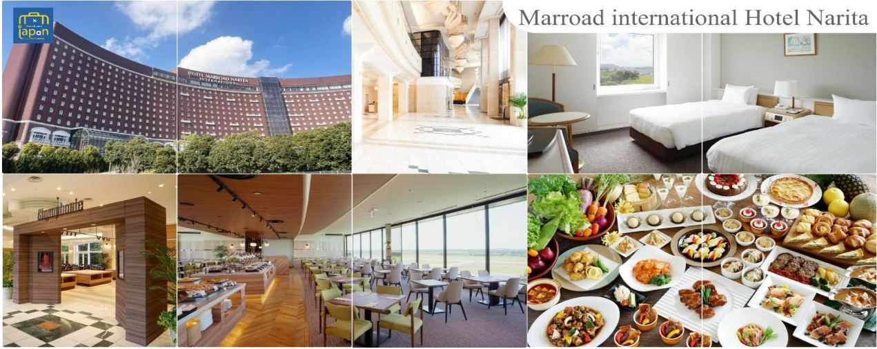
Marroad international Hotel Narita

ได้เวลาอันสมควรนำท่านเดินทางสู่ เมืองนาริตะ (Narita) (ใช้เวลาเดินทางประมาณ 1 ชั่วโมง) เย็น อิสระรับประทานอาหารเย็นตามอัธยาศัย พักที่ MARROAD INTERNATIONAL HOTEL NARITA หรือเทียบเท่าระดับเดียวกัน