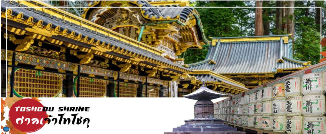
TOSHOGU SHRINE ศาลเจ้าโทโชกุ

เมืองนิกโกะ – ผ่านชม สะพานชินเคียว – ศาลเจ้าโทโชกุ – ศาลเจ้าฟutarะ – จังหวัดไซตามะ – ย่านเมืองเก่าคาวะโกเอะ – ตรอกลูกกวาด – เมืองยามานาชิ – ออนเซ็น + ชาบูยักษ์