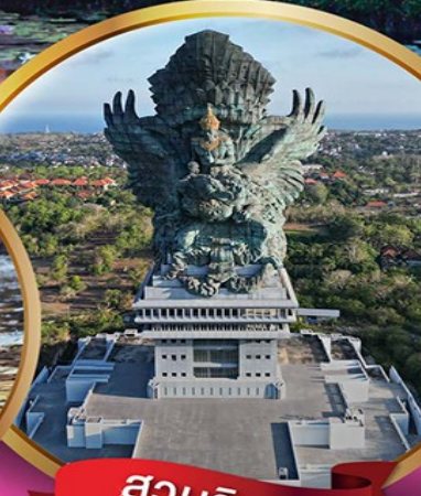
สวนวิชณู