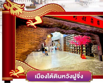
เมืองใต้ดินหวังฟูจิ่ง