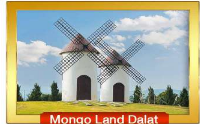
Mongo Land Dalat