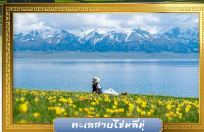
ทะเลสาบไซหลี่มู่