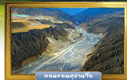
คองจอนตู่ชานจือ