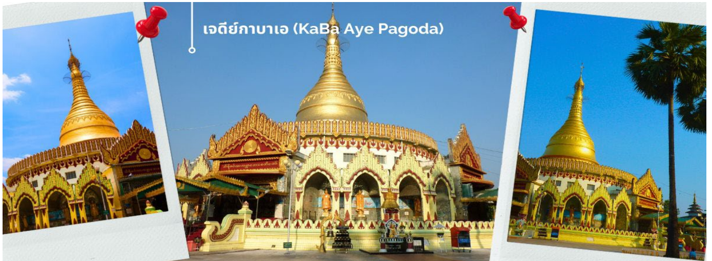
เจดีย์กาบาเอ (KaBa Aye Pagoda)

จากนั้นนำท่าน เดินทางไปยัง เจดีย์กาบาเอ (KaBa Aye Pagoda) เพื่อร่วมพิธี เทินพระธาตุ พิธีอันศักดิ์สิทธิ์ เป็นเจดีย์ทรงกลมครึ่ง ซึ่งมีความสูงทั้งหมดห้าด้านด้วยกัน นายอูหนายกคนแรกของพม่า ได้สร้างขึ้นเพื่อใช้เป็นสถานที่ชำระพระไตรปิฎก สูง 34 เมตร สร้างขึ้นเมื่อปี 1952 เพื่อทำการสังคายนา พระไตรปิฎกครั้งที่ 6 เป็นเจดีย์ที่มีความสวยงามและแปลกตา ภายในบรรจุพระอัฐิธาตุของพระอัครสาวกแห่งองค์พระสัมมาสัมพุทธเจ้า คือพระโมคคัลลานะและพระสารีบุตร จะมีทางเข้าทั้งหมดห้าด้าน ทุกด้านมีพระพุทธรูปประดิษฐานอยู่บนฐานทักษิณ มีพระพุทธรูปหุ้มด้วยทองคำองค์เล็กอีก 28 องค์ แทนอดีตสาวกของพระพุทธเจ้าทั้ง 28 องค์ ที่อุบัติขึ้นในโลกนี้ ส่วนพระพุทธรูปองค์พระประธานที่อยู่ข้างในหล่อด้วยเงินบริสุทธิ์มีน้ำหนัก กว่า 500 กิโลกรัม และ เข้าร่วมพิธีเทินพระธาตุเพื่อความเป็นสิริมงคล