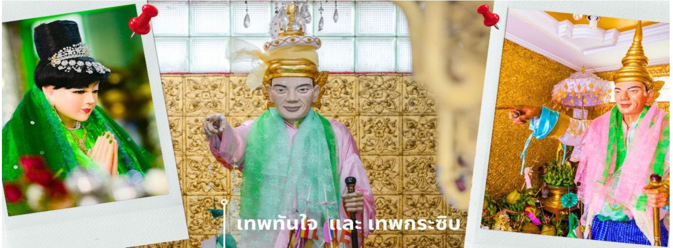
เทพทันใจ และ เทพกระซิบ