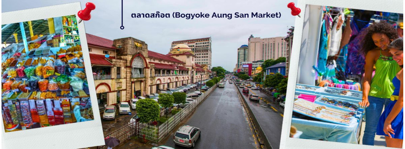
ตลาดสก๊อต (Bogyoke Aung San Market)

ให้ท่านได้มีเวลากับการเลือกซื้อของฝาก ของที่ระลึกต่างๆ ทั้งสินค้าพื้นเมืองที่มีชื่อเสียงของพม่าที่ ตลาดสก๊อต (Bogyoke Aung San Market) นี่คือนตลาดที่ใหญ่ที่สุดในย่างกุ้ง เป็นแหล่งช้อปปิ้งที่มีสินค้าวางขายแทบทุกชนิด เปรียบเสมือนตลาดนัดจตุจักรของบ้านเราก็ดูว่าได้ นอกจากสินค้าพื้นเมืองแล้ว ตลาดแห่งนี้ยังเป็นแหล่งรวมสินค้าประเภทอัญมณีที่เป็นที่รู้จักไปทั่วโลกนั่นคือ หยกพม่า (หากซื้อสินค้าหรืออัญมณีที่มีราคาสูง ควรขอใบเสร็จรับเงินทุกครั้ง เนื่องจากจะต้องแสดงให้เห็นเจ้าหน้าทีศุลกากรหากมีการขอตรวจสอบ)