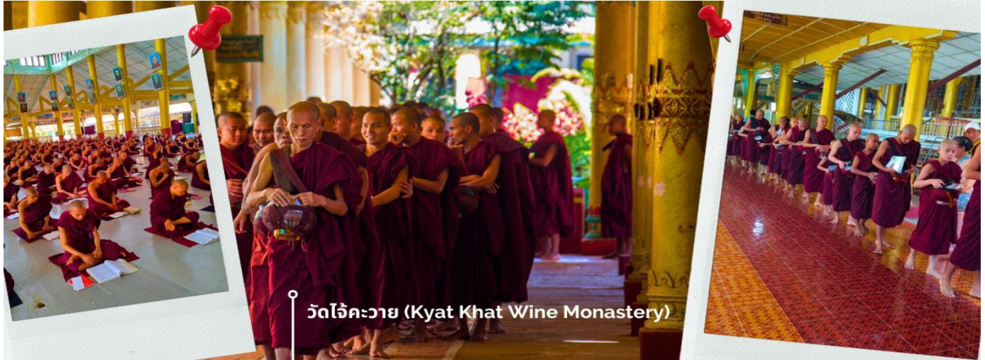
วัดใจคะวาย (Kyat Khat Wine Monastery)

นำท่านเดินทางลงจากพระธาตุนครอินทร์แขวน โดยใช้เส้นทางเดิม เพื่อมุ่งหน้าสู่เมืองหงสาวดี (ใช้เวลาเดินทางประมาณ 1 ชั่วโมง 30 นาที) เชิญร่วมทำบุญตักบาตรพระสงฆ์ ณ วัดใจคะวาย เมืองหงสาวดี มีพระสงฆ์กว่า 1000 รูป เป็นโรงเรียนสอนพระพุทธศาสนา นักธรรมชั้นตรี โท และ เอก เพื่อศึกษาพระไตรปิฎกเป็นจำนวนมาก ในช่วงสายของทุกวัน พระสงฆ์และเณร จะเดินออกมาบิณฑบาตเพื่อเตรียมฉันเพล โดยวัดแห่งนี้ได้รับการสนับสนุนจากชาวพุทธในพม่าเองและ นักท่องเที่ยวที่เดินทางมาที่วัด เพื่อทำการถวายเงินปัจจัย หรือ ข้าวสาร รวมไปถึง อุปกรณ์การเรียนและเครื่องเขียนต่างๆ เพื่อใช้ในการ ศึกษาธรรมะของพระสงฆ์และเณรในวัดใจคะวายแห่งนี้