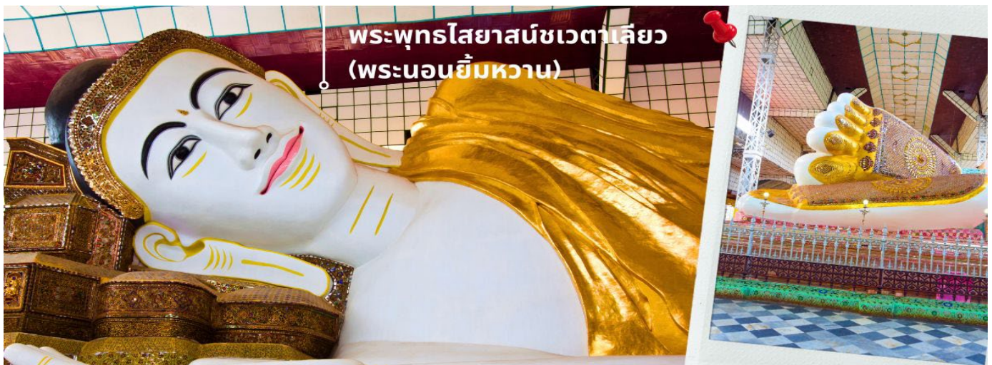
พระพุทธรูปไสยาสน์ชเวตาเลียว (พระนอนยี่มหวาน)

พระพุทธรูปไสยาสน์ชเวตาเลียว เป็นปูชนียสถานศักดิ์สิทธิ์อันดับสองของเมืองหงสาวดี รองจากมหาเจดีย์มูเตตา หรือที่คนไทยรู้จักกันในชื่อ "พระนอนยี่มหวาน" พระนอนชเวตาเลียว หรือ พระพุทธรูปไสยาสน์ชเวตาเลียว มีอายุเก่าแก่กว่า ๑,๒๐๐ ปี คนไทยรู้จักในนาม พระนอนยี่มหวาน เนื่องจากพระพักตร์ของท่านได้รับการวาดตกแต่งไว้อย่างสวยงามพร้อมด้วยรอยยี่มหวาน องค์พระเป็นศิลปะแบบมอญท่านสามารถที่จะเลือกหา เครื่องไม้แกะสลัก ที่มีให้เลือกมากมาย ตลอดสองข้างทางที่จะเดินเข้าไปสักการะองค์พระนอน และสินค้าพื้นเมืองอื่นๆ อาทิเช่น ผ้าพม่า ของที่ระลึกต่างๆอีกมากมาย