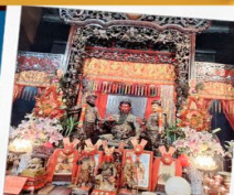
เทพเจ้ากวนอู วัดกวนไท่