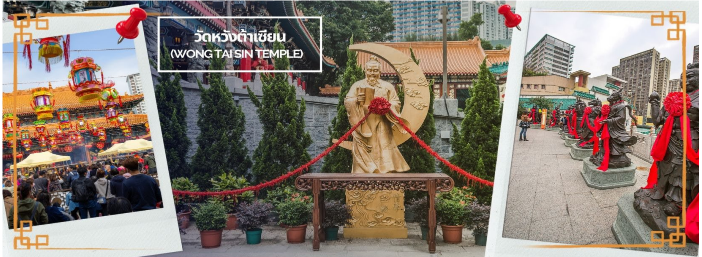
วัดหวังต้าเซียน (WONG TAI SIN TEMPLE)

นอกจากนั้นแล้ว ภายในวัดยังมี เทพเจ้าด้ายแดง หรือ เทพเจ้าหยุกโหลว รูปปั้นสีทอง มีเสี้ยวพระจันทร์อยู่