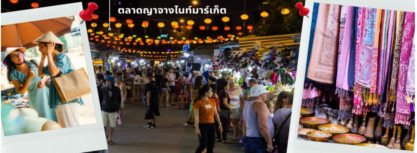
ตลาดญาจางไนท์มาร์เก็ต

ชื่อของฝากของที่ระลึก จนกลายเป็นแหล่งรวมนักท่องเที่ยว และวัยรุ่นในเมืองญาจาง ออกมาเดินเที่ยว และเลือกซื้อสินค้า กันอย่างคึกคัก