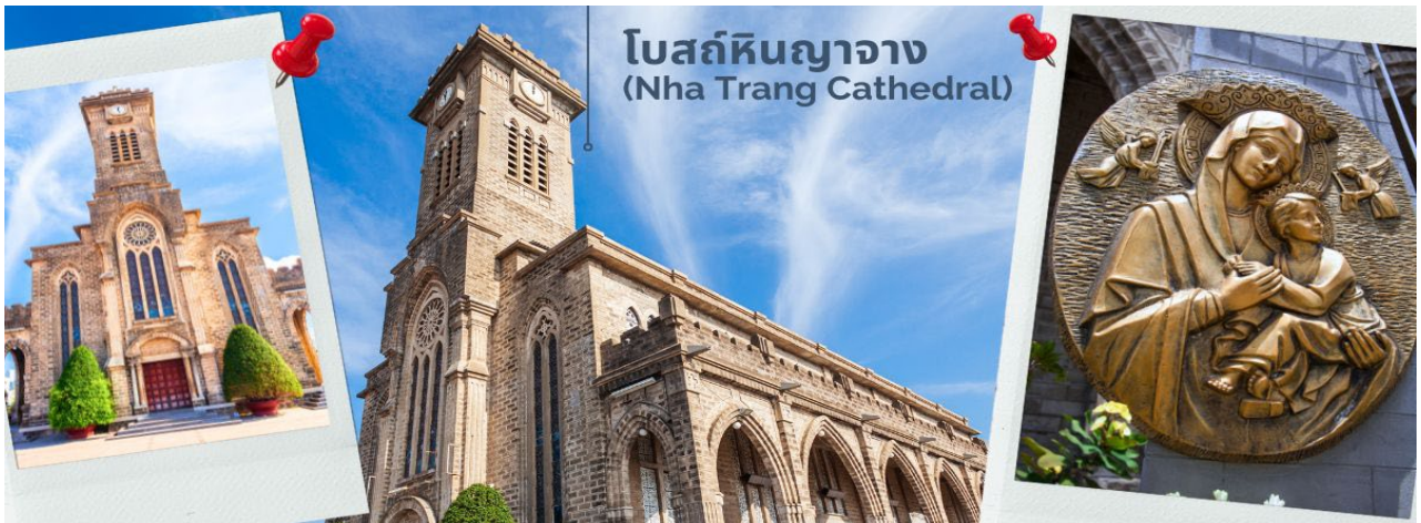
โบสถ์หินญางาง (Nha Trang Cathedral)

พาท่านชม โบสถ์หินญางาง (Nha Trang Cathedral) เป็นโบสถ์ที่ใหญ่ที่สุดในเมืองญางาง ตั้งโดดเด่นอยู่บนเนินสูง 10 เมตร ห่างจากทะเลเพียงแค่ 1 กิโลเมตร โบสถ์หลังนี้ถูกสร้างขึ้นในสไตล์ฝรั่งเศสโกธิก ภายในโบสถ์ถูกตกแต่งด้วยกระจกสีที่มีสีสันสวยงาม พื้นที่ภายในโบสถ์จะมี 760 ตร.กม. สามารถบรรจุคนได้ถึง 600 คน ตัวโบสถ์ถูกสร้างด้วยบล็อกซีเมนต์ และใช้หินในการปูพื้น