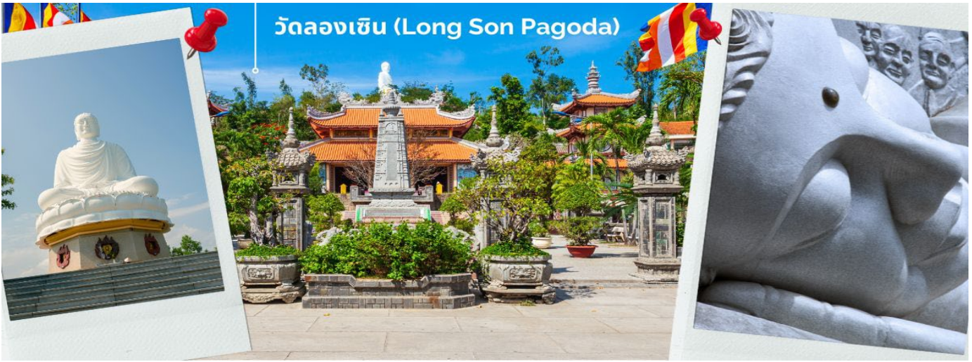
วัดลองเซิน (Long Son Pagoda)

นำท่านไหว้พระขอพรที่ วัดลองเซิน (Long Son Pagoda) วัดจีนเก่าแต่ตั้งอยู่บนเขามังกร เป็นวัดพุทธมหายานเก่าแก่และใหญ่ที่สุดของเมืองญางาง ประเทศเวียดนาม ที่วัดนี้มีจุดเด่นคือพระพุทธรูปองค์ใหญ่สีขาวสูงราว 14 เมตร การเที่ยวชมวัดลองเซินต้องเดินขึ้นบันได 152 ชั้น เพื่อไปนมัสการพระพุทธรูปองค์ใหญ่บนยอดเขาที่ประทับบนฐานดอกบัววัดนี้เป็นอีกหนึ่งไฮไลท์ที่ต้องแวะมาชมให้ได้ เพราะความสวยงามอลังการของตัววัดและวิวที่สามารถมองเห็นทิวเมืองญางางได้จากยอดเขา