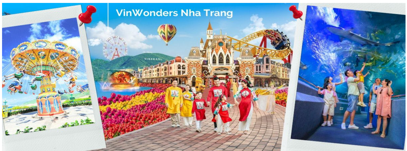
VinWonders Nha Trang

นำคณะขึ้นกระเช้าข้ามทะเล เพื่อข้ามไปยังเกาะ Hon Tre เที่ยวสวนสนุกวินวันเดอร์ (VinWonders Nha Trang) หรือ วินเพิร์ลแลนด์ ญาจาง (Vinpearl Land Nha Trang) ซึ่งเป็นสวนสนุกขนาดใหญ่ที่ตั้งอยู่บนเกาะอีกฝั่งของเมืองญาจางใหญ่ถึงการจนเราสามารถมองเห็นได้จากฝั่งชายหาดเมืองญาจาง นับเป็นสวนสนุกที่มีชื่อเสียงจากทั้งชาวเวียดนาม และชาวต่างชาติ และเป็นอีก 1 กิจกรรมที่ไม่ควรพลาด เพื่อคุณมาเยือนเมืองญาจาง โดยแบ่งพื้นที่ออกเป็น 6 โซนหลัก 1.Fairy Land 2.Adventure Land 3.King Garden 4.World Garden 5.Sea World 6.Tropical Paradise (ค่าทัวร์รวมค่าบัตรและเครื่องเล่นเรียบร้อยแล้ว)