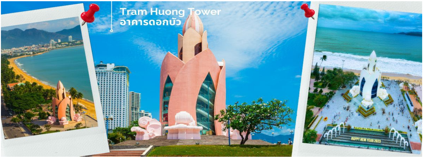
Tram Huong Tower อาคารดอกบัว

นำท่านชม ชายหาดเมืองญาจาง และ Tram Huong Tower อาคารดอกบัว เป็นสัญลักษณ์ของเมืองญาจาง ซึ่งมีส่วนส่งเสริมภาพลักษณ์ของเมืองชายฝั่งให้กับนักท่องเที่ยวทั้งในและต่างประเทศ ตัวอาคารมีจุดเด่นเป็นสถาปัตยกรรมจำลองรูปทรงดอกบัวที่สวยงาม เป็นอีกหนึ่งแลนด์มาร์คที่อยู่บนหาดญาจาง