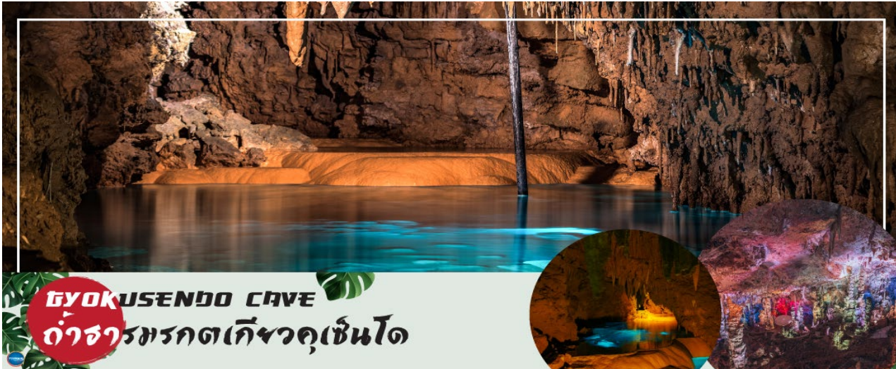
GYOKUSENDO CAVE ถ้ำธารมรดกเกียวกุเซ็นโด

จากนั้นนำท่านชม โรงงานแก้ว (GLASS FACTORY) (ใช้เวลาเดินทางประมาณ 20 นาที) ซึ่งตั้งอยู่บริเวณแหลมทางตอนใต้ของเกาะโอกินาวาโรงงานแห่งนี้เป็นโรงงานผลิตเครื่องแก้วที่ใหญ่ที่สุดในจังหวัดโอกินาวา เครื่องแก้วทั้งหมดทำด้วยเทคนิคการขึ้นแก้วดั้งเดิม โดย