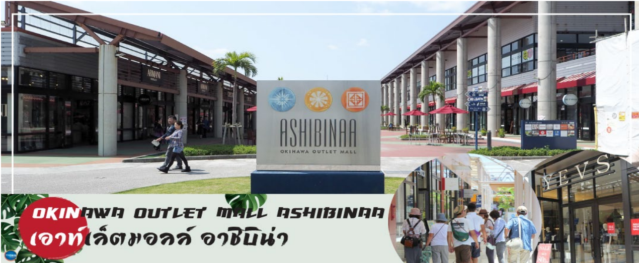
OKINAWA OUTLET MALL ASHIBINAA เอาท์เล็ตมอลล์ อาชิบิโน่า

จากนั้นนำท่านสู่ เอาท์เล็ตมอลล์ อาชิบิโน่า (Okinawa Outlet Mall Ashibinaa) (ใช้เวลาเดินทางประมาณ 30 นาที) เอาท์เล็ตแห่งแรกในโอกินาวะ รวบรวมร้านค้าชั้นนำกว่า 100 ร้าน ทั้งเสื้อผ้าแฟชั่น สินค้าแบรนด์เนม นาฬิกา ข้าวของเครื่องใช้ ของเล่น ทุกร้านจัดเต็มทั้งสินค้านำเข้าและรุ่นใหม่ ลดราคากระหน่ำกว่า 30-80% ให้ได้เดินช้อปปิ้งตัวยุโรปกันอย่างจุใจ ภายใต้บรรยากาศสบายๆ สไตล์รีสอร์ทริมทะเล หากช้อปปิ้งเหนื่อยสามารถขึ้นไปทานอาหารที่ชั้น 2 มีอีกหลายร้านที่คอยให้บริการ