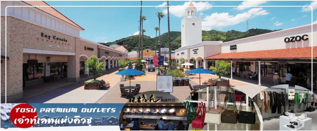
TOSU PREMIUM OUTLETS เอ้าท์เล็ตแห่งคิวชู