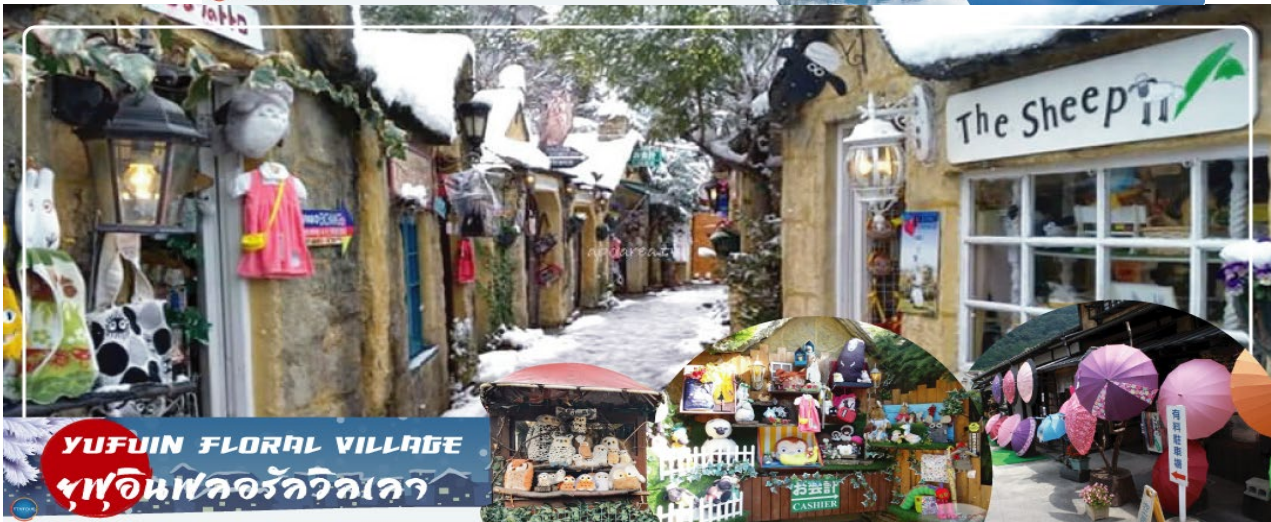
YUFUIN FLORAL VILLAGE ยุฟุอินฟลอรัลวิลเลจ