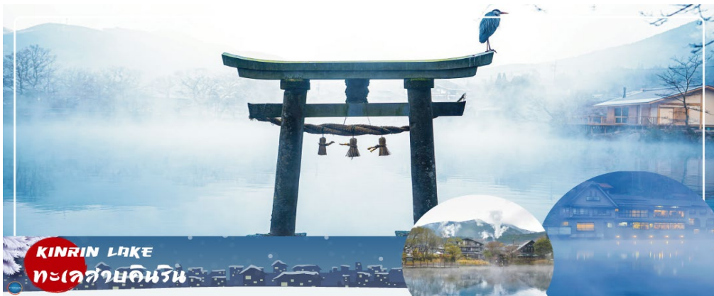
KIRIN LAKE ทะเลสาบคิริน

และร้านขายของเก่า ของกระจุกกระจิกมากมาย ระหว่างทางไม่ควรพลาดที่จะแวะ ยุฟุอิน ฟลอรัลวิลเลจ (Yufuin Floral Village) ซึมปาร์คในบรรยากาศแห่งเทพนิยายที่ดูราวกับกำลังหลงเข้าไปในเหมือนจำลองหมู่บ้านสไตล์ยุโรป ร้านค้าทุกหลังเป็นสีเหลืองที่มีแต่ร้านที่มีสินค้าเป็นเอกลักษณ์ !!! ไฮไลท์ ประจำเมืองยุฟุอิน บ้านอิฐที่แสนคลาสสิคเรียงรายอยู่บนถนนสายเล็กๆ ประดับประดาไปด้วยดอกไม้บานาชนิด ภายในหมู่บ้านมีถนนช้อปปิ้ง มีร้านรวงต่างๆ ที่ตกแต่งได้อย่างน่ารัก ร้านไอศกรีม หรือ คาเฟ่น่ารักๆ อย่าง Alice Tea คาเฟ่สุดชิคบรรยากาศเหมือนอยู่ในป่าและจิบน้ำชากับ Mad Hatter หรือจะเป็นร้านขนม ที่มีเค้าโครงมาจาก Kiki's Delivery Service กลิ่นหอมของขนมปังอบอวล น่ากินสุดๆ นอกจากนี้ยังมี จุดพักผ่อนหย่อนใจให้เชื่อง่อนเซ็นทำอีกมากมาย เดินเลยจากถนนช้อปปิ้งไปท่านจะได้พบความงามของ ทะเลสาบคิริน (Kirin Lake) น้ำทะเลสาบใสเห็นตัวปลาแหวกว่ายในผืนน้ำ บางช่วงมีหมอกบางๆ ลง นับว่าคุ้มค่ากับการมาเห็นความงามนี้ด้วยตาตัวเองสักครั้งหนึ่งอย่างแน่นอน อิสระให้ท่านเดินเล่นและถ่ายรูปตามอัธยาศัย