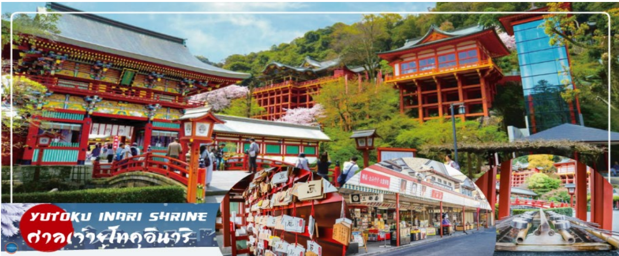
YUTOKU INARI SHRINE ศาลเจ้ายุโทคุอินาริ

ศาลเจ้ายุโทคุอินารินั้นถูกสร้างขึ้นเมื่อประมาณ ปี ค.ศ. 1688 ซึ่งเป็นศาลเจ้าที่บูชาศาสนาพุทธนิกายชินโต และยังเป็นศาลเจ้าอินาริที่ใหญ่และสำคัญเป็นอันดับ 3 รองมาจาก ศาลเจ้าฟุชิมิอินาริ(Fushimi Inari Shrine)ในเกียวโต(Kyoto) และศาลเจ้าคะซะมาอินาริ(Kasama Inari Shrine) ในอิบาระกิ(Ibaraki)อีกด้วยนะคะ โดยศาลเจ้าแห่งนี้ได้เป็นศาลเจ้าประจำตระกูลนาเบชิมะ(Nabeshima clan)