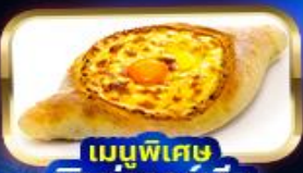
เมนูพิเศษ พิซซาจอร์เจีย Khachapuri

นั่งกระเช้าขึ้นชมวิวนบนเขาบอร์โจมิ อนุสาวรีย์มิตรภาพรัสเซีย-จอร์เจีย ป้อมอนาบุรี พิพิธภัณฑท์ โจเซฟ สตาลิน เมืองถ้ำโบราณ อุทยานแห่งชาติบอร์โจมิ โบสถ์เกลลาตี เข้าชมถ้ำถ้ำไฟรมีร์จอส โบสถ์เมเตร์คิ สะพานสันติภาพ นั่งกระเช้าเคเบิลขึ้นชมป้อมนารีกาลา ไรอาบน้ำโบราณ อะบาโนตูปานี วิหารสเวติสเคอเวรี มหาวิหารจวารี