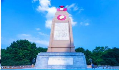
อนุสาวรีย์พิงหว