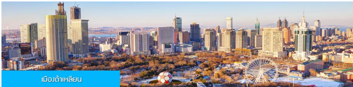
เมืองต้าเหลียน