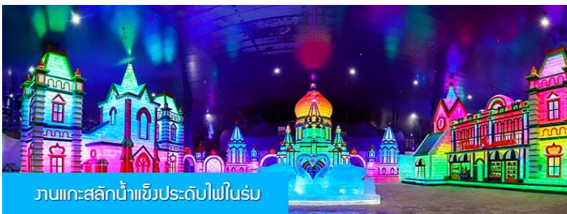
งานแกะสลักน้ำแข็งประดับไฟในร่ม

พักที่ VODKA MANOR RESORT รีสอร์ทที่ตั้งอยู่ในอุทยานสวนสไตล์รัสเซีย