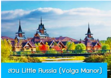
สวน Little Russia (Volga Manor)