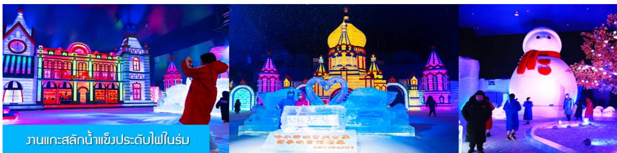
งานแกะสลักน้ำแข็งประดับไฟในร่ม

หลังอาหารนำท่านเที่ยวชม งานแกะสลักน้ำแข็งประดับไฟในร่ม 哈尔滨冰雪小世界 เป็นงานจัดแสดงประติมากรรมน้ำแข็งแกะสลักประดับไฟในร่มที่ใหญ่ที่สุดในโลก งานประติมากรรมน้ำแข็งทุกชิ้นถูกออกแบบเสมือนจริง ตกแต่งด้วยแสงสีอย่างตระการตา เพื่อให้นักท่องเที่ยวที่มาเยือนในช่วงนอกฤดูหนาวได้สัมผัสความยิ่งใหญ่อลังการของงานเทศกาลแกะสลักน้ำแข็งนานาชาติที่จัดขึ้นในช่วงฤดูหนาวของทุกปี ทางผู้จัดงานได้ทุ่มทุนสร้างอาคารห้องเย็นขนาดใหญ่บนเนื้อที่ 23,800 ตารางเมตร ภายในปรับอุณหภูมิติดลบ 8-12 องศาเซลเซียสพร้อมงานแกะสลักน้ำแข็งขนาดเล็กใหญ่ประดับแสงสีตระการตาจำนวนมากให้ผู้มาเยือนได้ชื่นชม..... จากนั้นนำท่านชม โบสถ์โซเฟีย 索菲亚教堂 (ชมด้านนอก) อีกหนึ่งสัญลักษณ์ที่โดดเด่นของเมืองฮาร์บิน สร้างขึ้นในปี ค.ศ. 1907 เป็นโบสถ์คริสต์นิกายออร์ทอดอกซ์ที่ใหญ่ที่สุดในเอเชียตะวันออก ที่แสดงถึงอิทธิพลของวัฒนธรรมรัสเซียที่มีต่อเมืองฮาร์บิน