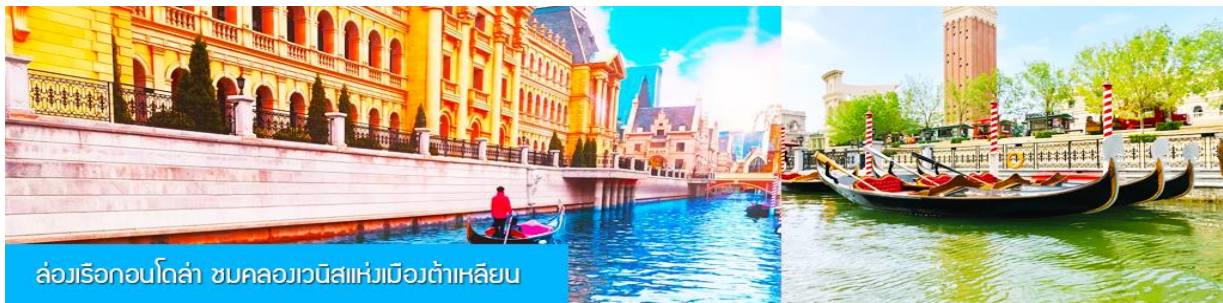
ล่องเรือกอนโดลา ชมคลองเวนิสแห่งเมืองต้าเหลียน

นำท่านเดินทางถึงสถานีรถไฟเมืองต้าเหลียน นำท่านเดินทางโดยรถบัสปรับอากาศสู่ตัวเมืองต้าเหลียน