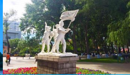
สวนสตาลิน

วันที่ 1 เมืองฮาร์บิ้น – ศูนย์การค้าว่่านต้า – (สามารถเลือกซื้อโปรแกรมเสริมลานหิมะร้อนมหัศจรรย์) อนุสาวรีย์ป้องกันอุทกภัย -สวนสตาลิน – ถนนคนเดินจงย้งต้าเจีย POP MART