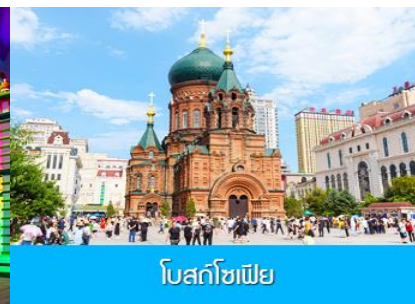
โบสถ์โซเฟีย