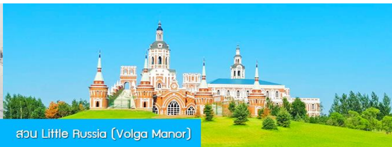
สวน Little Russia (Volga Manor)