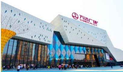
ห้างว่่านต้าสแควร์