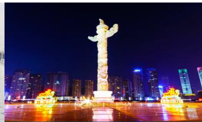
จัตุรัสซิงไห่