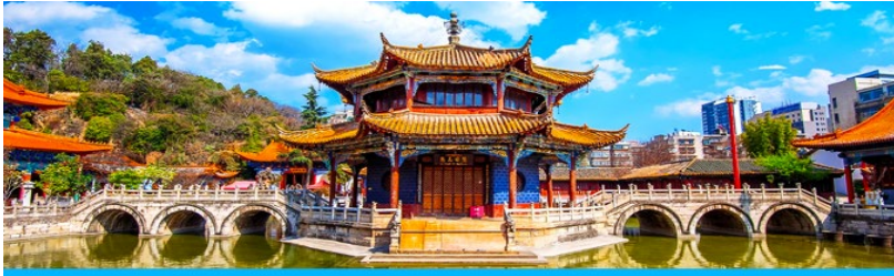
วัดหยวนกง