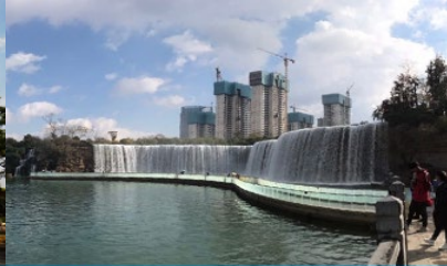
สวนน้ำตก Kunming Waterfall Park