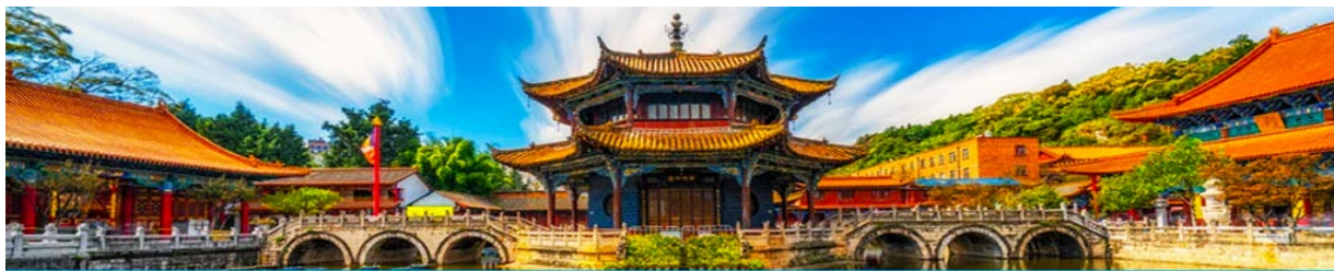
วัดหยวนกวาง

พักที่ VIENNA HOTEL ระดับ 4 ดาว หรือเทียบเท่าในเมืองคุนหมิง