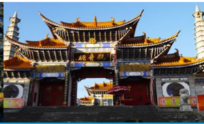
วัดเจ้าแม่กวนอิมแปลงกาย