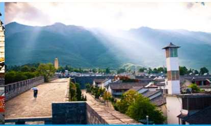
หมู่บ้านฮิวโจว(หมู่บ้านชาอู๋ป๋อ)