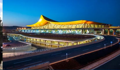
สนามบินเมืองคุนหมิง