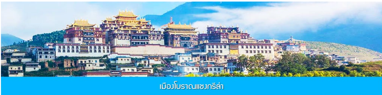
เมืองโบราณแซงกรี่ล่า

จากนั้นนำท่านชม หมู่บ้านซีโจวหรือหมู่บ้านชาวไป่ ชนพื้นเมืองที่สำคัญของเมือง ชมการแสดงของชนชาติปายพร้อมชิมชาสามแก้ว เพื่อรำลึกถึงวิถีชีวิตและการเกิดมาเป็นมนุษย์ของตนเอง ซึ่งถือเป็นเอกลักษณ์ของชนชาวไป่ ที่หาดูได้ยาก