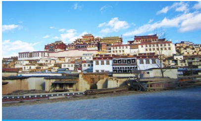
วัดลามะซัวบหลิง