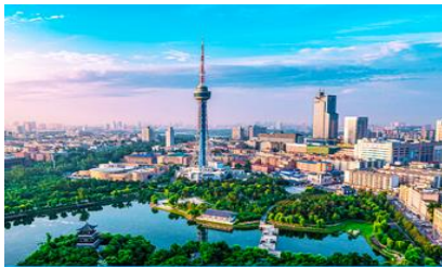
เมืองห้หลิบ

23.30 น. คณะพร้อมกัน ณ ท่าอากาศยานสุวรรณภูมิ อาคารผู้โดยสารระหว่างประเทศขาออกอาคาร ชั้น 4 ประตู 10 เคา์นเตอร์สายการบิน SHENZHEN AIRLINES พบเจ้าหน้าที่บริษัทฯ คอยให้การต้อนรับและอำนวยความสะดวกด้านเอกสารและสัมภาระก่อนการเดินทาง