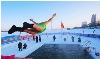
ชมการแสดงว่ายน้ำในฤดูหนาว

พักที่ HARBIN SHUIMU CITY SPRING HOTEL 4* หรือโรงแรมในระดับเดียวกันย่านชานเมืองฮาร์บิน