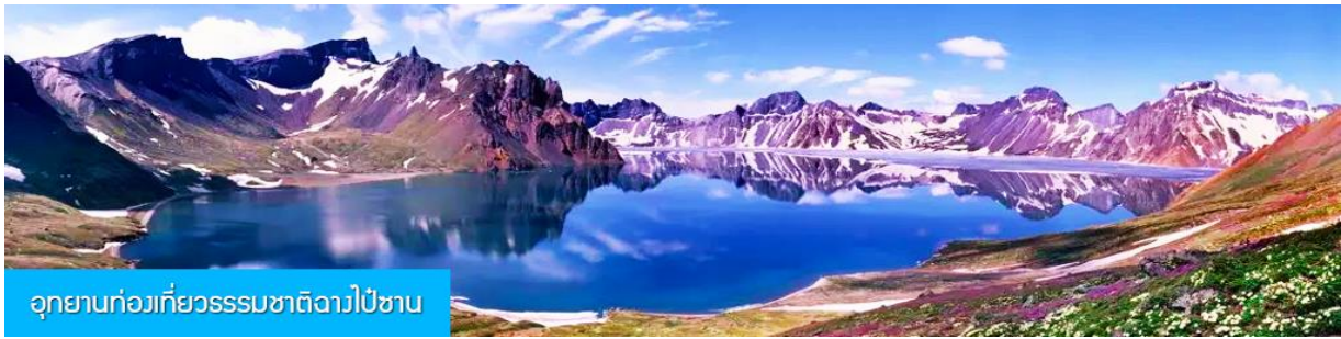
อุทยานท่งเกี้ยวธรรมชาติฉางไป๋ชาน