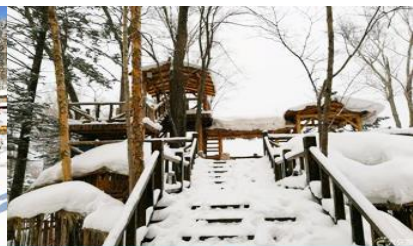
ระเบียงชบวบั้งดูชาน