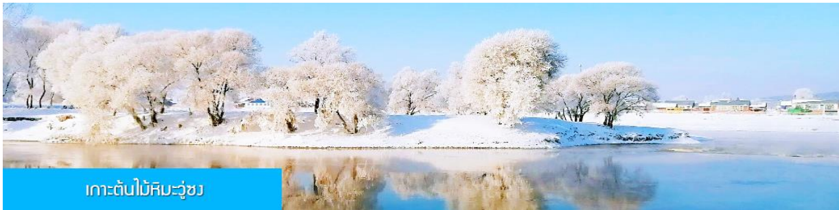
เกาะต้นไม้หิมะวู้ซง

พักที่ RENWICK HOTEL 4* หรือ โรงแรมในระดับเดียวกันในเมืองจีหลิน