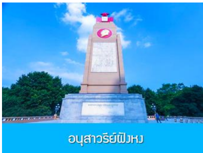
อนุสาวรีย์ฝั่งหง

ชมและถ่ายภาพกับ รูปปั้นตึกตาคหิมะยักษ์ 网红大雪人 เป็นตึกตาคหิมะขนาดใหญ่ความสูง 18 เมตร ที่ทางเทศบาลเมืองฮาร์บินจัดทำขึ้นในช่วงฤดูหนาวของทุกปี เช่นเดียวกับการประดับต้นคริสมาสในช่วงเทศกาลของชาวตะวันตก จนกลายเป็นสัญลักษณ์แห่งฤดูหนาวของเมืองฮาร์บิน