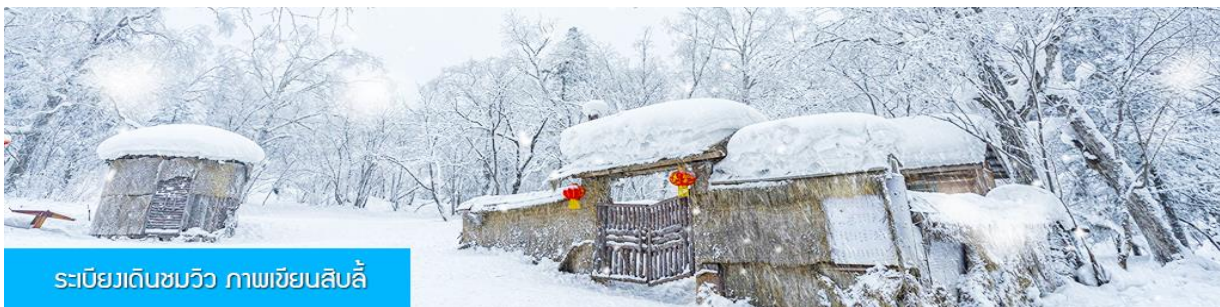
ระเบียบเดินชมวิว ภาพเขียนสิบสี่

ระหว่างทางไกด์ท้องถิ่นจะเสนอขายโปรแกรมเสริมที่ไม่ได้รวมในค่าทัวร์ (ออฟชั่นแนลทัวร์) 2 รายการ