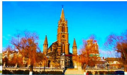
โบสถ์คอกทอลิก