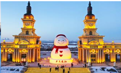
ตุ๊กตาหิมะยักษ์