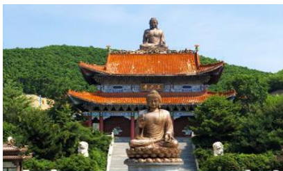
อวค์พระพุทธรูปใหญ่จินตัง