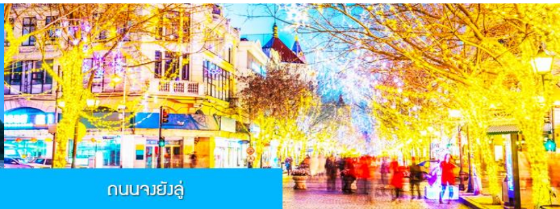
ถนนจงหยางต้าเจีย