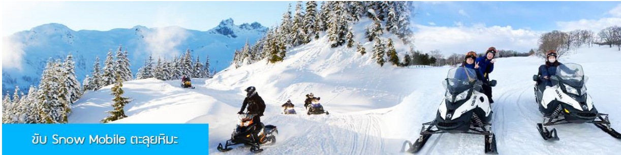
ขับ Snow Mobile ตะลุยหิมะ

ค่าบริการ ท่านละ 300 หยวน หรือ 1500 บาท อัตรานี้รวมค่าบัตรผ่านเข้าอุทยาน ค่ารถรับ ส่ง และค่าบริการของไกด์ท้องถิ่น และค่าบริการจัดการของบริษัททัวร์ท้องถิ่น.....หมายเหตุ โปรแกรมเสริมเป็นโปรแกรมที่ท่านต้องเสียค่าใช้จ่ายเองด้วยความสมัครใจ สำหรับท่านที่ไม่เข้าร่วมกิจกรรมดังกล่าวสามารถนั่งพักในรถได้