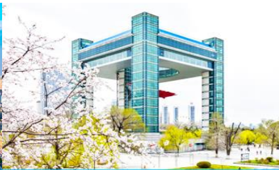
จิ๋จู่ส ช้อจี้