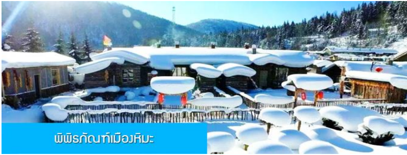
พิพิธภัณฑสถานหิมะ

พนักงานยกกระเป๋า มาคอยบริการยกกระเป๋าให้ผู้เข้าพัก ท่านควรจัดเตรียมกระเป๋าใบเล็กที่บรรจุเสื้อผ้า และ เครื่องใช้จำเป็นสำหรับการพักผ่อน ณ โฮมสเตย์ในเมืองหิมะในคืนนี้ เพื่อสะดวกต่อการเคลื่อนย้ายกระเป๋า หมายเหตุ 2 ห้องพักในหมู่บ้านหิมะเป็นโฮมสเตย์ขนาดเล็ก เครื่องอำนวยความสะดวกและบริการอาหารมีค้ำและมือเช้าจะ ไม่ทัดเทียมกับโรงแรมในเมือง และมีอาหารในภัตตาคารได้, ท่านควรเตรียมผ้าเช็ดตัว แปรงสีฟัน ยาสีฟัน และเครื่องใช้ส่วนตัวที่จำเป็นนำติดตัวไปด้วย