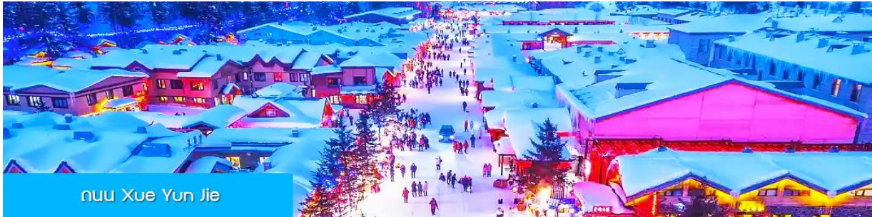
ถนน Xue Yun Jie