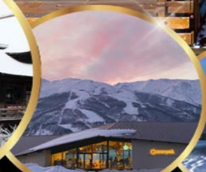
Snow peak land hukuba