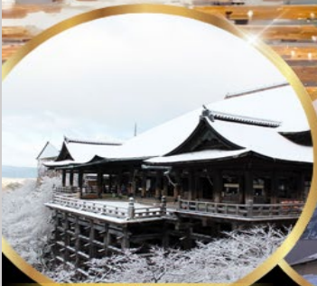
วัด คิโยมิสึ