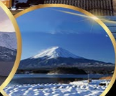
สวน โออิชิ พาร์ค

ราคา เริ่มต้น 55,919 บาท รวมภาษีมูลค่าเพิ่ม 7%