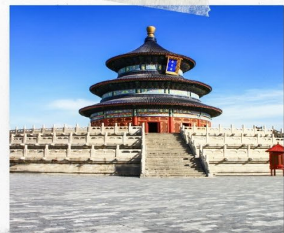
หอบูชาเทียนถาน