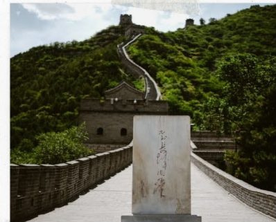
กำแพงเมืองจีน ด่านจวิหยงกวน