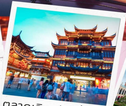
ตลาดเจิ้งหวังเหมี่ยว