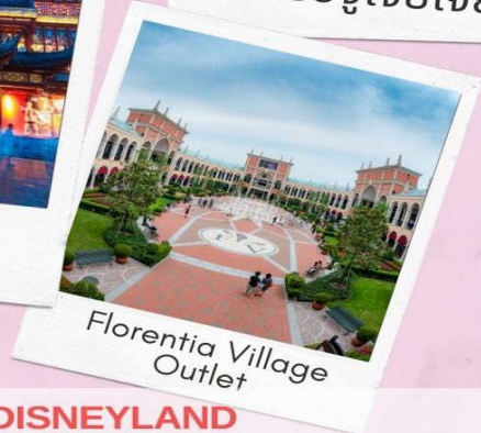
Florentia Village Outlet