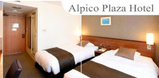
Alpico Plaza Hotel