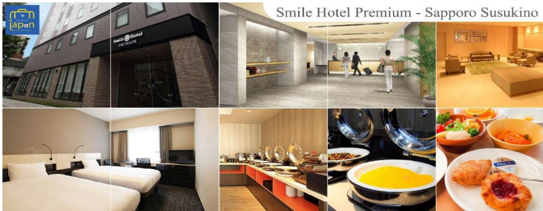
Smile Hotel Premium - Sapporo Susukino

รับประทานอาหารเย็น ณ ภัตตาคาร (3) พิเศษ!!! เมนู นพเฟตซามู + ซาปู SMILE HOTEL PREMIUM - SAPPORO SUSUKINO หรือเทียบเท่าระดับเดียวกัน