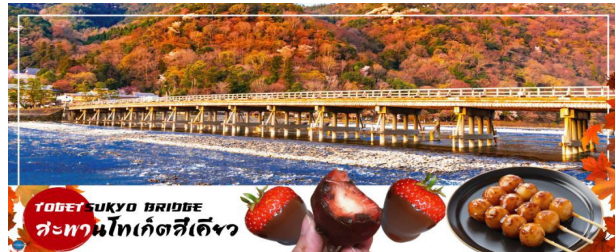
TOGETSU KYO BRIDGE สะพานโทเก็ตสึเดียว

นำท่านชม สวนป่าไผ่ (Bamboo Groves) เป็นเส้นทางเดินเล็กๆที่ตัดผ่านในกลางสวนป่าไผ่ สามารถเดินเล่นหรือชิวๆฉายผ่านก็ได้ ให้บรรยากาศที่แปลกและหาได้ยาก อีสาระให้ท่านเดินชมความงามยามที่มีแสงอาทิตย์ลอดผ่านตัวป่าไผ่ลงมายังพื้นด้านล่าง ประกอบกับมีลมพัดมาพร้อมกันก็จะเป็นเสียงกึกก้องของต้นไม้กระทบกันไปมา ดูสวยงามและให้บรรยากาศโรแมนติกยิ่งนัก บริเวณใกล้ๆจะเป็นร้านขายของพื้นเมืองที่ท่ามาจากต้นไม้ เช่น ตะกร้าไม้ไผ่, ถ้วย, กล้องใสของ หรือเสื้อสานจากไผ่ อีสาระให้ท่านซื้อสินค้า หรือเลือกถ่ายภาพเก็บความประทับใจตามอัธยาศัย