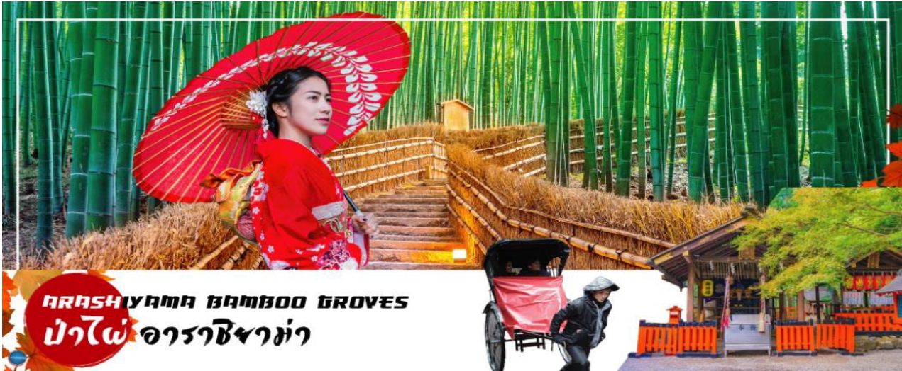
ARASHIYAMA BAMBOO GROVES ป่าไผ่ อาราชิม่า

01.00 น. เห็นฟ้าสู่ เมืองโอซาก้า ประเทศญี่ปุ่น โดยเที่ยวบินที่ XJ612