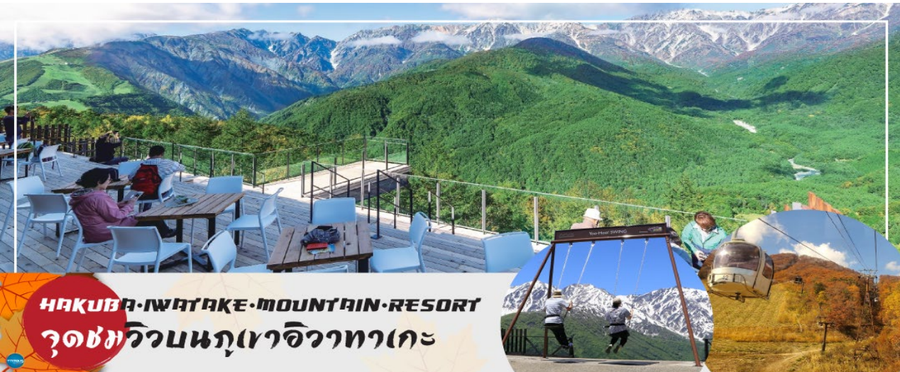
HAKUBA IWATAKE MOUNTAIN RESORT จุดชมวิวนกภูเขาอิวาทากะ

เมืองมัตสึโมโตะ – เมืองนากาโนะ – ฮาคุบะ – HAKUBA IWATAKE MOUNTAIN RESORT (คอนโดล่า ลิฟท์) – ไร่อาซาบิไดโอะ – เมืองยามานาชิ – อุโมงค์ใบเมเปิ้ล (ขึ้นอยู่กับฤดูกาล) – หมู่บ้านโอชิโนะสั๊กไก – ออนเซ็น + ซาฟายักษ์