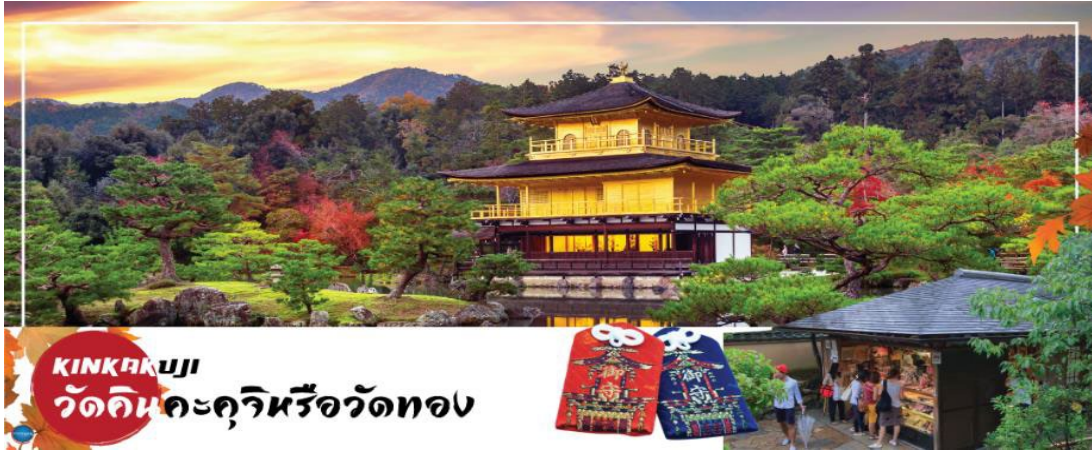
KINKAKUJI วัดคินคะคุจิหรือวัดทอง

ให้ท่าน ช้อปปิ้งย่านซาคาเอะ (Sakae) เป็นย่านธุรกิจการค้า โดยเฉพาะ แหล่งราตรี เช่น คลับและบาร์ มีห้างสรรพสินค้ามัตสึซากาเอะ หรือ เมืองใต้ดิน (Central Park) แหล่งรวมแฟชั่นและร้านค้าสุดเก๋มากมาย เช่น ร้านเสื้อผ้า, ร้านของใช้กระจุกกระจิก, ร้านชาลอนความงาม เป็นต้น แฟนๆ ไอศกรีมญี่ปุ่น ห้ามพลาด ต้องมาเยือนห้างสรรพสินค้าชั้นไนซ์ ซาคาเอะ ซึ่งเป็นจุดศูนย์กลางแหล่งรวมความบันเทิงมากมาย ที่มี Grand Canyon ฮอลล์จัดคอนเสิร์ตศิลปินไอศกรีมและยังเป็นคาเฟ่ นอกจากนี้ที่นี่ยังเป็นสถานที่ตั้งของ "ชิงช้าสวรรค์ Sky Boat" แลนด์มาร์คของย่านนี้อีกด้วย