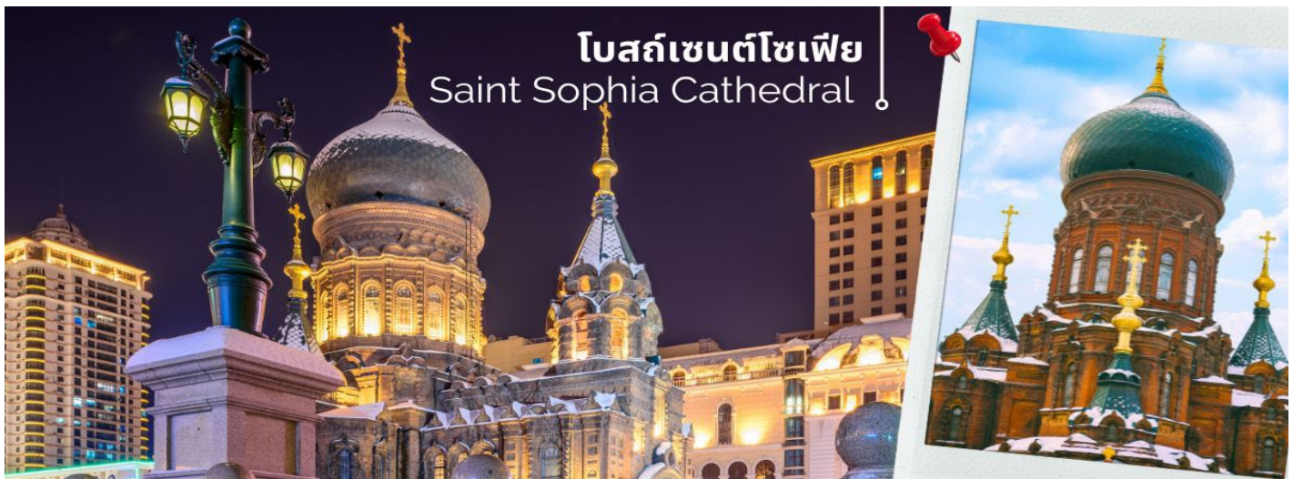
โบสถ์เซนต์โซเฟีย Saint Sophia Cathedral

เช้า 10) รับประทานอาหารเช้า ณ ห้องอาหารโรงแรม (12) นำท่านเที่ยวชม โบสถ์เซนต์โซเฟีย(ถ่ายรูปจากด้านนอก) ซึ่งเป็น 1 ในโบสถ์คริสต์ 17 แห่ง ซึ่งแสดงถึงวัฒนธรรมรัสเซียที่ได้เข้ามามีอิทธิพลในฮาร์บิน โบสถ์โซเฟีย เป็นโบสถ์นิกายออร์ทอด็อกซ์ที่สร้างขึ้นในปี ค.ศ 1907 เป็นโบสถ์ออร์ทอด็อกซ์ที่ใหญ่ที่สุดในภาคพื้นเอเชียตะวันออก