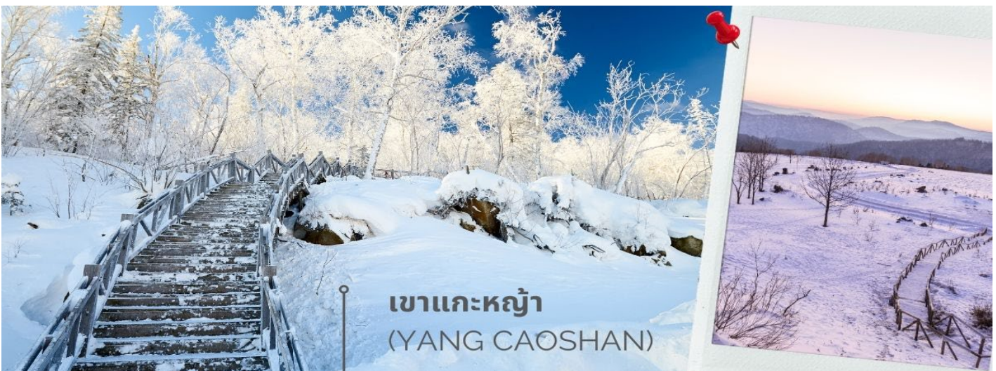
เขาแกะหย้า (YANG CAOSHAN)

นำท่านเดินทางสู่ เขาแกะหย้า (YANG CAOSHAN) ซึ่งมีความสูงกว่าระดับน้ำทะเล 1,235 เมตร ถือว่าเป็นเนินเขาที่สูงที่สุดของหมู่บ้าน ห่างจากเมืองหิมะประมาณ 4.5 กิโลเมตร นับว่าเป็นจุดชมวิวพระอาทิตย์ขึ้นและพระอาทิตย์ตกที่งดงามเป็นอย่างมาก