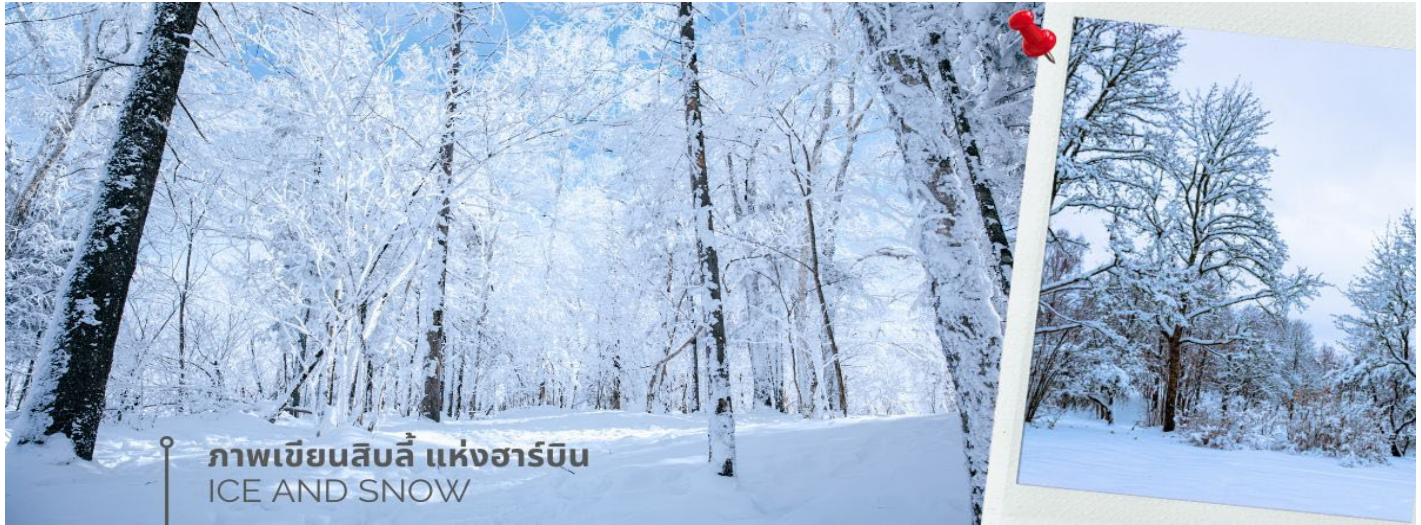
ภาพเข็ยนสิบลี แห่งฮาร์บิน ICE AND SNOW

เที่ยง 10) รับประทานอาหารกลางวันที่ภัตตาคาร (10) เมนูพิเศษ ... เกี่ยวตงเป่ย นำท่านเดินทางกลับเมืองฮาร์บิน (ใช้เวลาเดินทางประมาณ 3.30 ชั่วโมง) เมืองหลวงของมณฑลเฮยหลงเจียง มีช่วงฤดูหนาวมากกว่าฤดูร้อนและเลื่องชื่อในฐานะเป็นเมืองน้ำแข็งของประเทศ