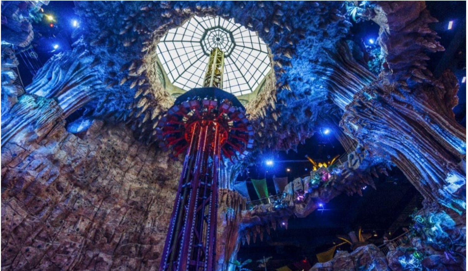
หรือ Alpine coaster)

โซนสวนสนุก The Fantasy Park ให้ท่านได้สัมผัสกับประสบการณ์ที่เต็มไปด้วยเสน่ห์แห่งตำนานและจินตนาการของการผจญภัยเครื่องเล่นในสวนสนุกของบานาฮิลล์ มีหลากหลายรูปแบบมีให้ท่านเลือก อาทิ เช่น โรงภาพยนตร์ 4D รถไฟเหาะแมงมุมที่ชวนให้ทุกท่านระทึกขวัญไปกับเครื่องเล่น รถราง หรือ Alpine coaster และอีกมากมาย นอกจากนี้ยังมีร้านช้อปปิ้งให้ท่านได้เลือกซื้อของที่ระลึกภายในสวนสนุกอีกด้วย (ราคาทัวร์รวมค่าเครื่องเล่นภายในสวนสนุกทุกเครื่องเล่น ยกเว้นพิพิธภัณฑ์หุ่นขี้ผึ้ง เครื่องเล่นที่ใช้ระบบหยอดเหรียญ และ รถราง